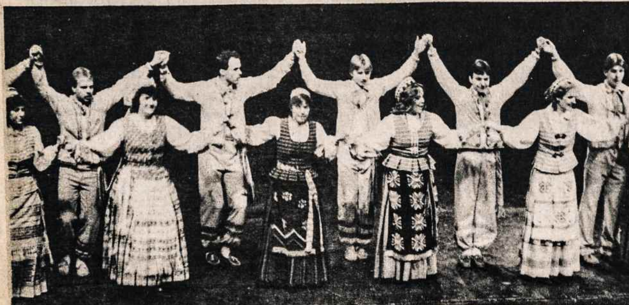
Berželis, Hartfordo tautinių šokių grupė, šoka landytinį Lietuvos nepriklausomybės minėjimą.

VYTIS INTERNATIONAL TRAVEL SERVICE 2129 KNAPP STREET BROOKLYN, N.Y. 11229 TEL.: 718 769-3300