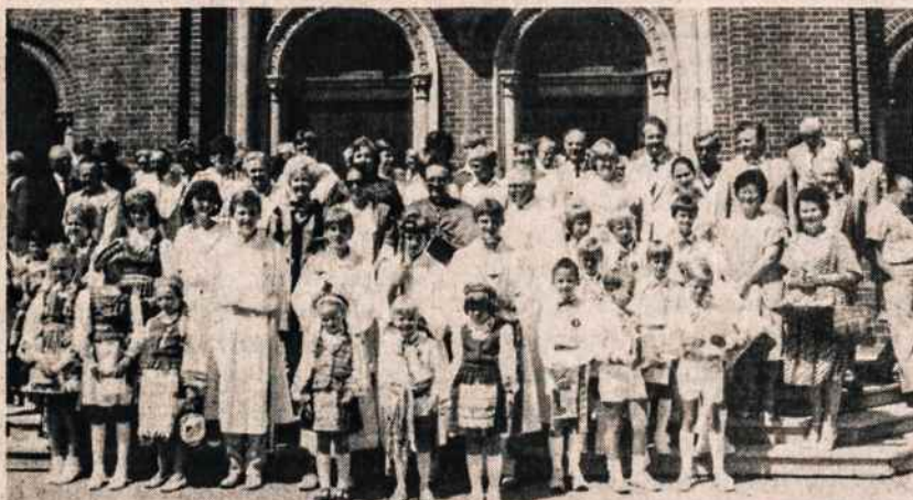
Sydnėjaus lietuviai prie katedros durų su vysk. P. Baltakiu, OFM.