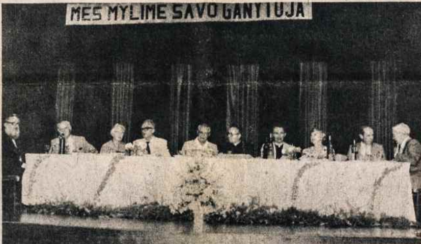
Lietuvių namuose garbės svečių stalas. Scenoje įrašyta — Mes mylime savo ganytoją.