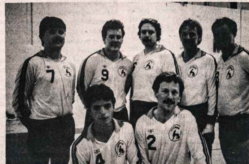
Baltimorės LAK vyrų tinklinio komanda Sporto žaidynėse Detroitė.