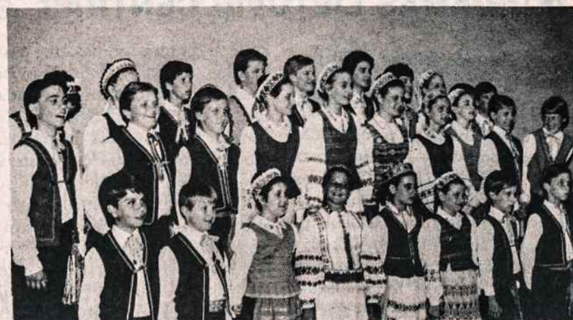
Jaunieji Grandinėlės šokėjai laukia koncerto programos. Jų koncertas buvo balandžio 21 Clevelande.

Savo vaikams, kurie išsikelia gyventi į kitus miestus, užsakykite Darbininką!