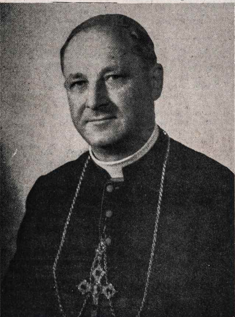
Vysk. Vincentas Brizgys gegužės 19 paminėjo 45 metų sukaktį, kaip jis buvo konsekruotas vyskupu. Tada buvo jauniausias vyskupas visame pasaulyje. Jis yra gimęs 1903 lapkričio 10, kunigu įšventintas 1927 birželio 5. Sveikiname Jo Ekscelenciją!

VYTIS INTERNATIONAL TRAVEL SERVICE 2129 KNAPP STREET BROOKLYN, N.Y. 11229 TEL.: 718 769 - 3300