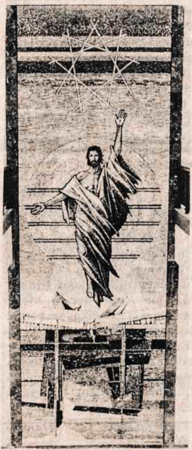
Kristaus Prisikėlimas, dail. Albino Elskaus mozaika, 33 pėdų aukščio, 11 pėdų pločio, sukurtas 1983 m. Holy Cross Cemetery naujojo mauzoliejaus koplyčioje North Arlington, N.J. Mozaika buvo atlikta Crovatto studijoje Italijoje ir Yonkers, N.Y.

Įdomus tas ankstyvas periodas, kada nebuvo dar išgalvoti pašto ženklai. Ant užsilikusiu laikų matome tiesius antspau-