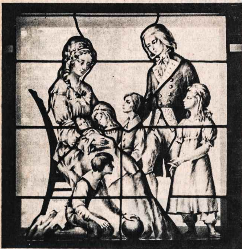
Seton šeima New Yorke 1803 m. Vitražo detalė iš Šv. Elizabeth Ann Bayley Seton bažnyčios Shrub Oak.