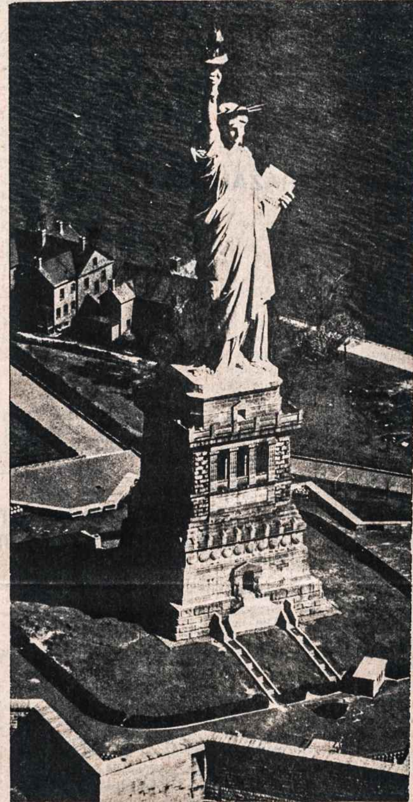
Didingoji Amerikos Laisvės statula, pati garsiausia visame pasaulyje, pavergtiem kraštam virtusi laisvės simboliu.