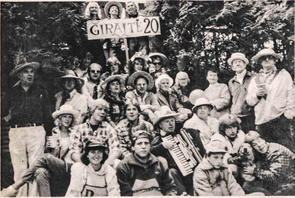
Dalis "Giraitės" kaimo gyventojų savo 20 metų sukaktuvinėje šventėje. Nuotraukoje matomos Alksninių, Alytų, Jurių, Bemotų, Kezių, Daukantų, Nenortų, Tamošinių šeimos. Trūksta Jurevičių, Baltrušionių, Pesytės, Gedimino Rajecko.