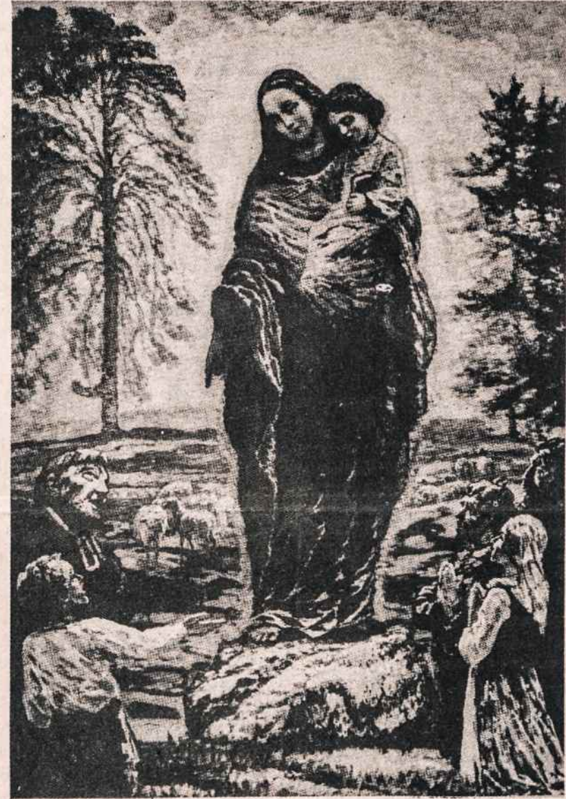
Marijos apsišveikimas Šiluvoje. Dail. Adomo Varno pieštas paveikslas. Marijos apsišveikimo šventė Šiluvoje švenčiama rugsėjo 8. Kasmet ten suvažiuoja daugybė žmonių iš visos Lietuvos, ir okupantams sudaro daug rūpesčio, kaip sutramdyti žmonių pamaldumą.

BALFas buvo įsteigtas įvairių pažiūrų Amerikos lietuvių grupių bendromis pastangomis su vienu bendru tikslu — padėti ir gelbėti nelaimės ištiktą