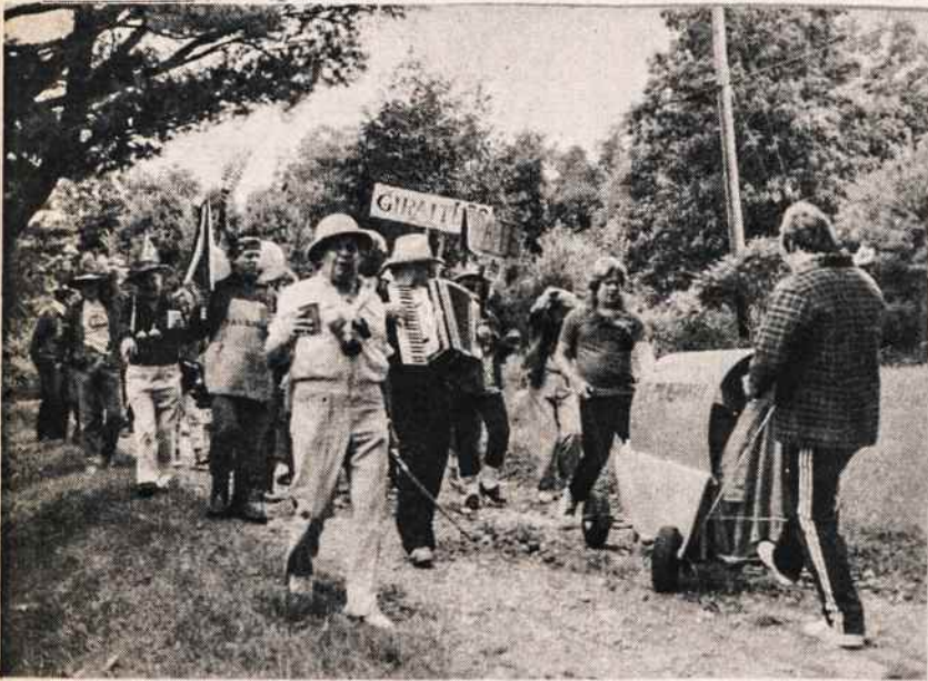
Lietuviškas "Giraitės" kaimas Connecticut valstybėje rugsėjo 1 šventė 20 metų sukaktį. Dainuodami dainas, lanko kiekvieno gyventojų namus. Priekyje vežama alaus statinaitė.