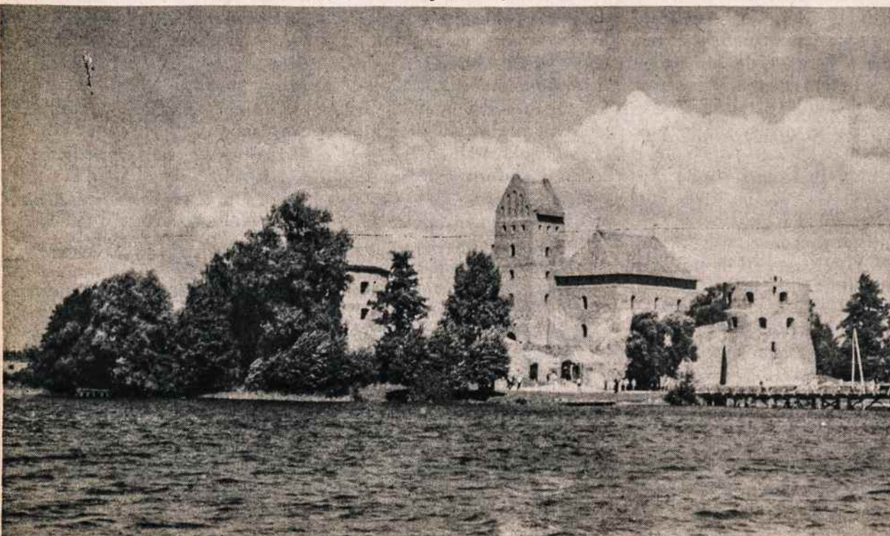
Atremontuota Trakų pilis, kuri matė ir pergyveno Vytauto galybės laikus. Čia ir mirė Vytautas 1430 spalio 27 d. Pradėtas pilies atstatymo darbas okupantų buvo sustabdytas.

Stilius poetiškai paprastas, ir knyga skaitoma su įdomumu.