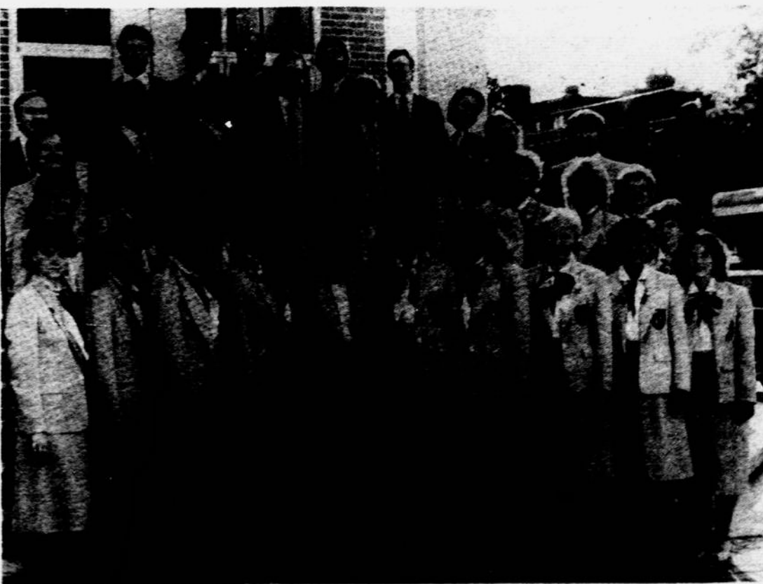
Toronto Gintaro ansamblio vyresnioji grupė, kuri atvyksta koncertuoti į New Yorką. Jų koncertas bus lapkričio 2 Kultūros Židinyje. Rengia Laisvės Židinio radijas. (Žiūr. skelbimą).