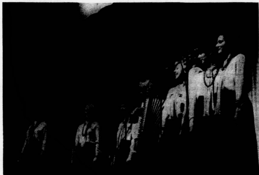
Toronto ansambli Gintaras Kultūros Židinio scenoje. Mergaitės dainuoja estradines dainas.

VYTIS INTERNATIONAL TRAVEL SERVICE 2129 KNAPP STREET BROOKLYN, N.Y. 11229 TEL.: 718 769 - 3300