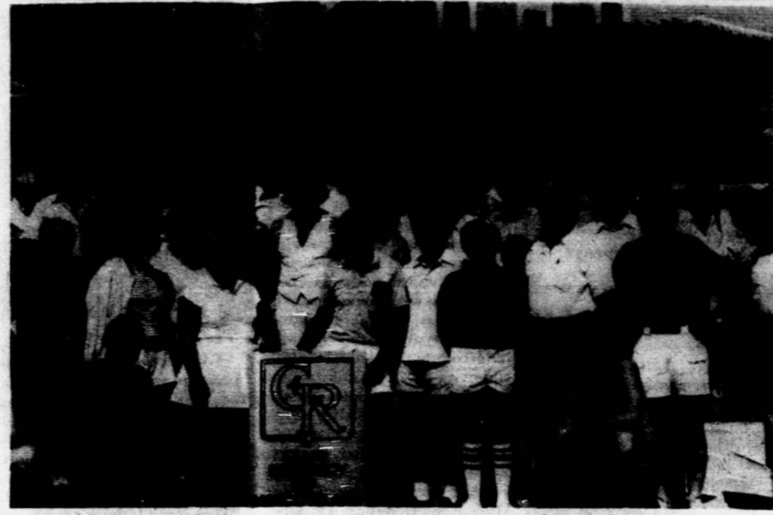
Dalis ekonominės konferencijos dalyvių ir atostogautojų Marco Island, Floridoje.

Tautinės sąmonės išlaikymui išsivijioje yra reikalingi visi auklėtojai, švietėjai, organiza-