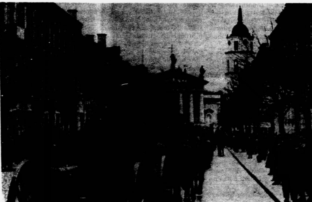
Lietuvos kariuomenė žygioja Vilniuje 1939 metais spalio 29 d.