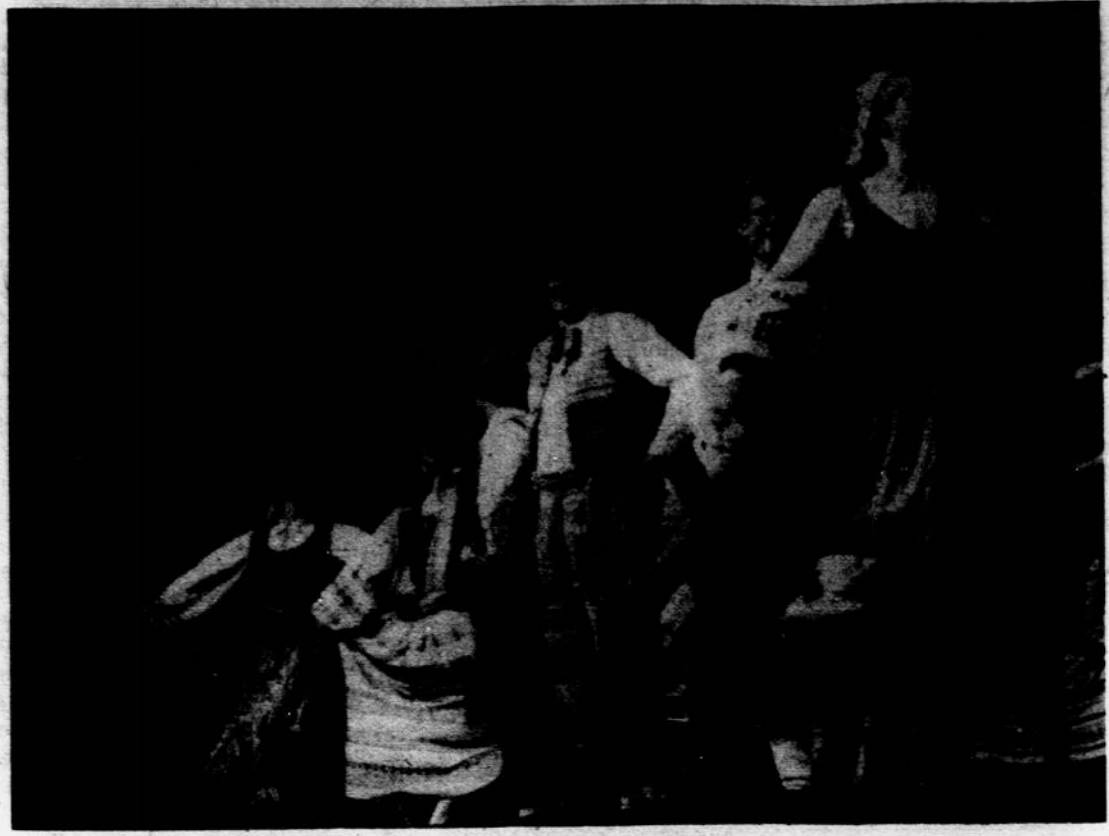
Tautinius šokius šoka Toronto ansamblis Gintaras Kultūros Židinio scenoje. Nuotr. A. Prekerio

Margaspalvių lietuviškais raštais juostų arba lietuviškų rankšluosčių galima įsigyti Darbininko spaudos kioske. Kaina su persiuntimu 20 dol. Kreiptis: Darbininkas, 341 Highland Blvd., Brooklyn, N.Y. 11207.