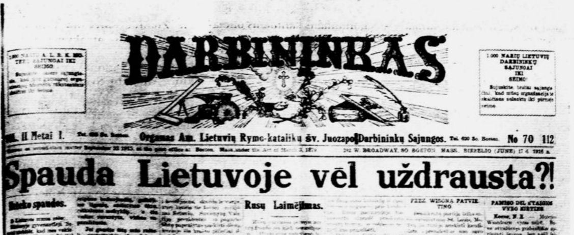
Darbininko laikraščio pirmo puslapio vinjetė iš 1916 metų birželio 17 d. Tai buvo I-mojo pasaulinio karo metai. Apie tai rašoma daug pirmame puslapyje.

Netrukus pasirodė, kad seimas teisingai pramatė lenkų užmačius. Dar tų pačių metų lapkričio mėn. ir 1984 m. vasario mėn. naujos, aktyvios lenkų organizacijos Pomost prašomį Kongreso atstovas Tom Corcoran ir senatorius Robert W. Kasten įnešė į Kongresą rezolucijas, pagal kurias Amerikos Jungti-