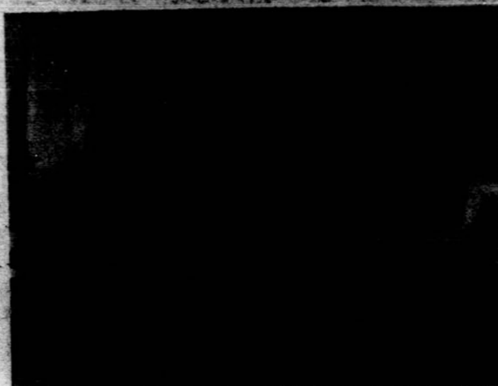
Mokytoja Eglė Vainienė skaito su ketvirtuo skyriaus mokiniais.