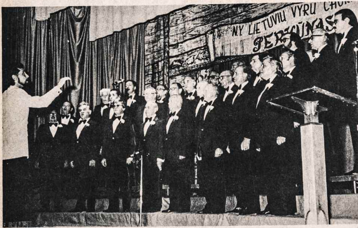
Perkūno choras koncerto metu Kultūros Židinyje.