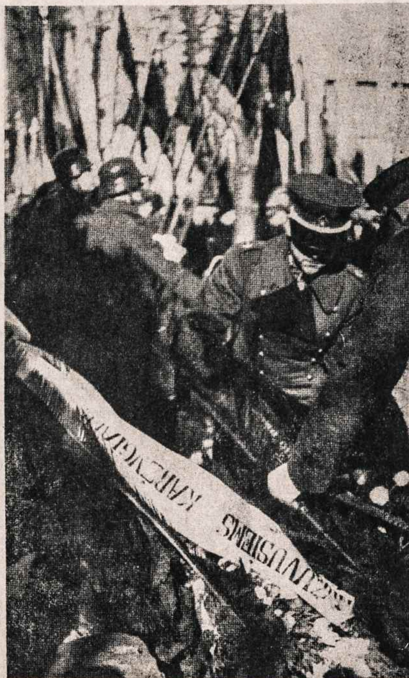
Nepriklausomo Lietuvos laikais, minint Lietuvos nepriklausomybės šventę, ant Nežinomo kario kapo vainiką deda kariuomenės vadas gen. St. Raštikis.

Šakiai. 1985 balandžio 2 į Šakių vykdomąjį komitetą buvo sukviesti rajono bažnyčių dvi-