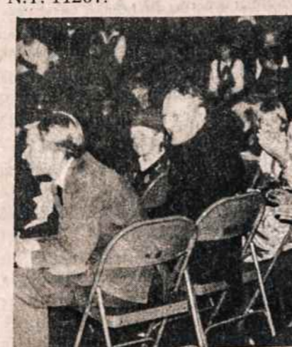
Clevelande šv. Kazimiero lituanistinės mokyklos kalėdinę programą visi seka su šypsena. Programa buvo gruodžio 23.

Aukas prašome siųsti Tautos Fondas, P.O. Box 21073, Woodhaven, N.Y., 11421. Testamentuose prašykite:.....to Lithuanian National Foundation, not-for-profit, tax exempt Corporation, 345 Highland Blvd., Brooklyn, N.Y. 11207.