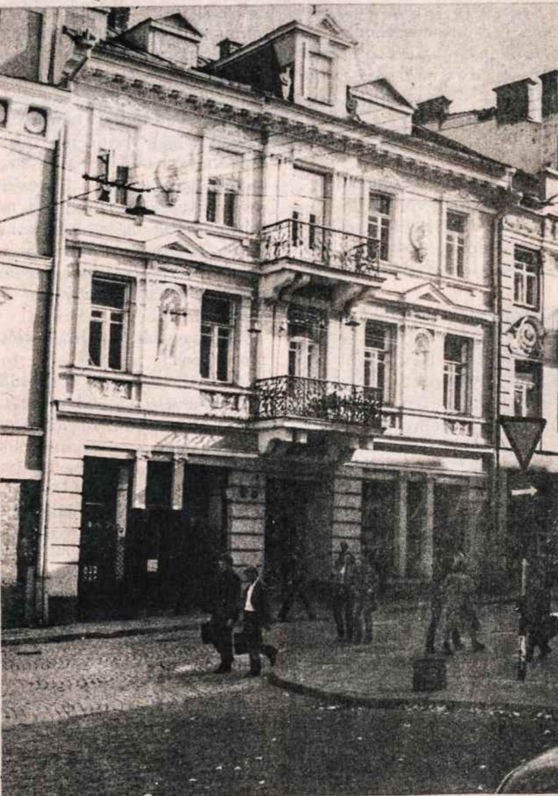
Namas Pilies gatvėje Vilniuje, netoli šv. Jono bažnyčios kur antrame aukšte buvo Lietuvos Tarybos būstinė. Čia ir posėdžiavo Lietuvos Taryba 1918 metais vasario 16 ir čia paskelbė Lietuvos nepriklausomybės atstatymą.