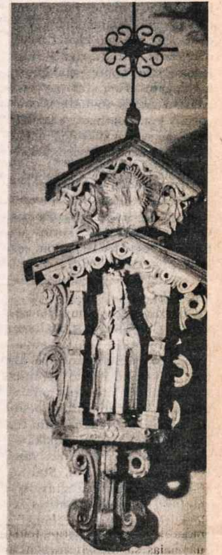
Dail. Jurgio Daugvilos drožinėta koplytėlė — Šv. Kazimieras