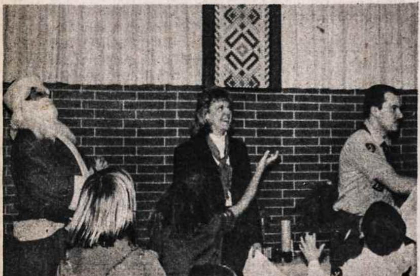
Kalėdų senelis atėjo pas skautus į kalėdinę sueigą Clevelande.