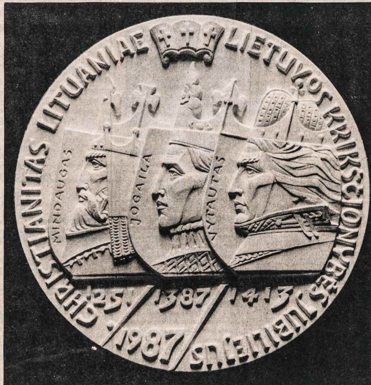
Skulptoriaus Vytauto Kašubos Lietuvos krikšto 600 metų sukakčiai paminėti sukurtas medalio viena pusė vaizduoja tris Lietuvos valdovus: karalių Mindaugą ir kunigaikščius Jogailą ir Vytautą. Nurodyti ir metai, kuriais Lietuva buvo krikščionys. Kiekvieno valdovo profilis yra skydo fone, ir ritmingas skydų išdėstymas pabrėžia valdovų vieningą pasiryžimą įvesti krikščionybę krašte. Trys kryželiai virš karūnų akcentuoja faktą, kad ryšium su krikščionybės įvedimu Lietuvoje buvo trys atžymėtini įvykiai.

Čilės Santiago mieste per vieną naktį buvo išsprogdinta 21 bomba, sužeidus 21 žmogų.