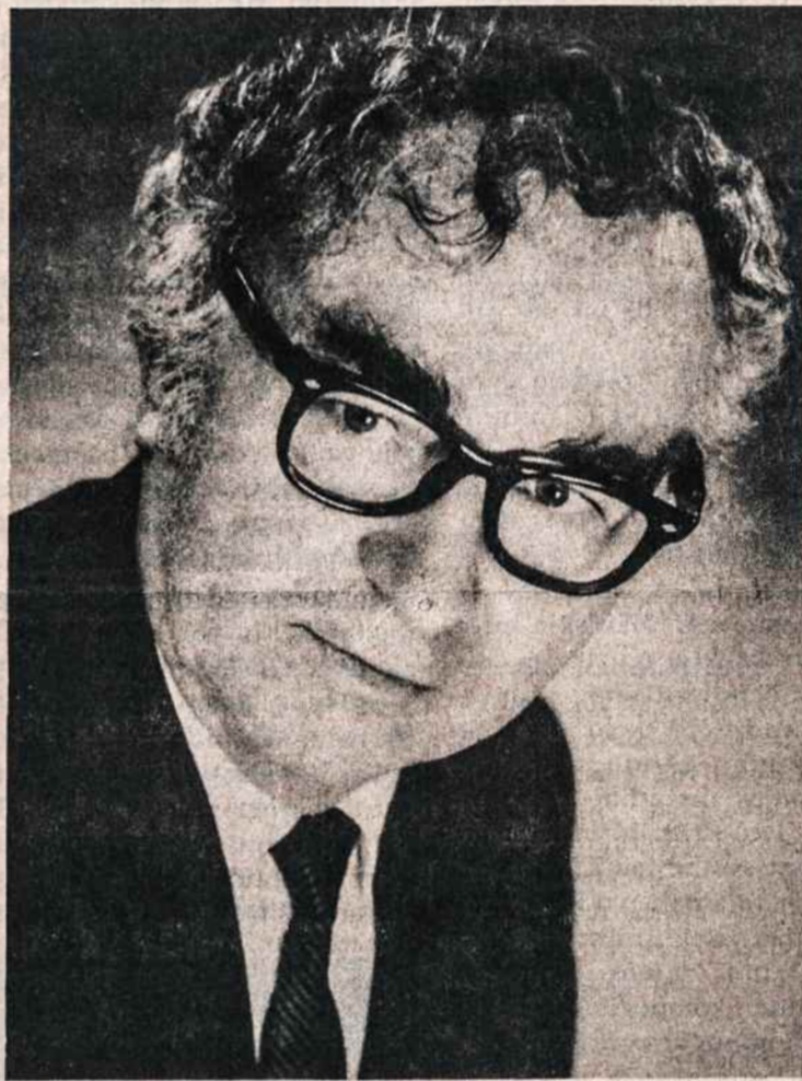
Poetas Bernardas Brazdžionis — Vytė Nemunėlis balandžio 20, šį sekmadienį, 3 val. popiet dalyvauja literatūros ir muzikos popietėje So. Bostone Lietuvių Piliūčių draugijos salėje.

Tokią pat nuotaiką sukelia ir "Lietuvos Katalikų Bažnyčios" (nukelta į 5 psl.)