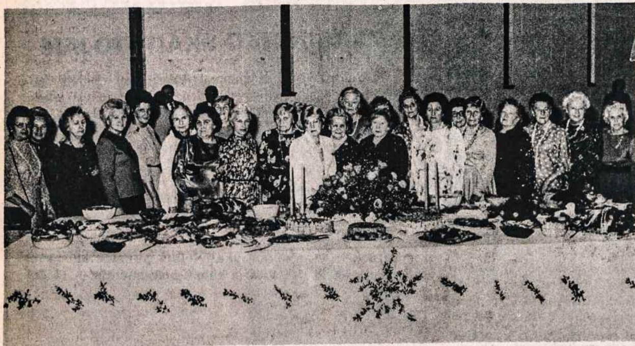
Lietuvių Moterų Klubų Federacijos New Yorko klubo narės prie puošnaus ir gausaus Atvelykio stalo Kultūros Židinyje balandžio 6.