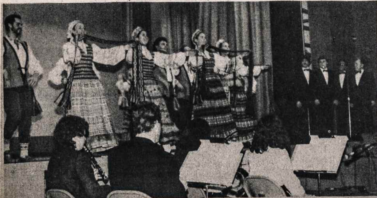
Grandinėlė atlieka programą per Vasario 16 minėjimą Clevelande.