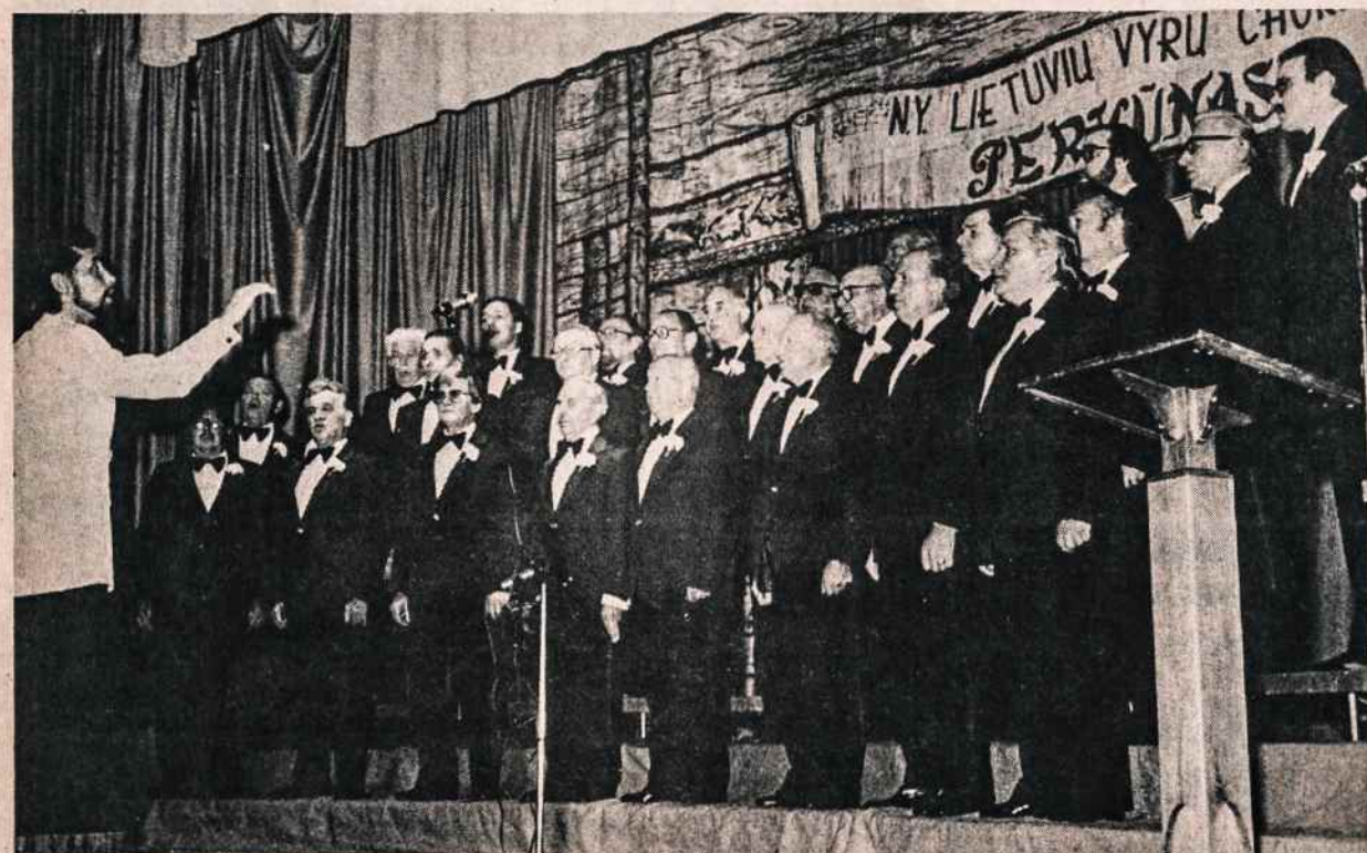
Perkūno choras koncerto metu Kultūros Židinyje.

N. Y. lietuvių vyrų choro "Perkūnas" metinis koncertas ir balius įvyks birželio 7, šeštadienį, Kultūros Židinio patalpose.