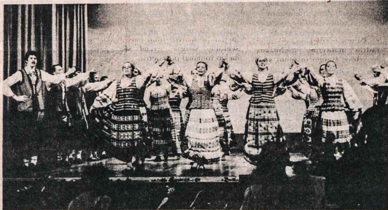
"Grandinėlės" šaukus šokėjai.