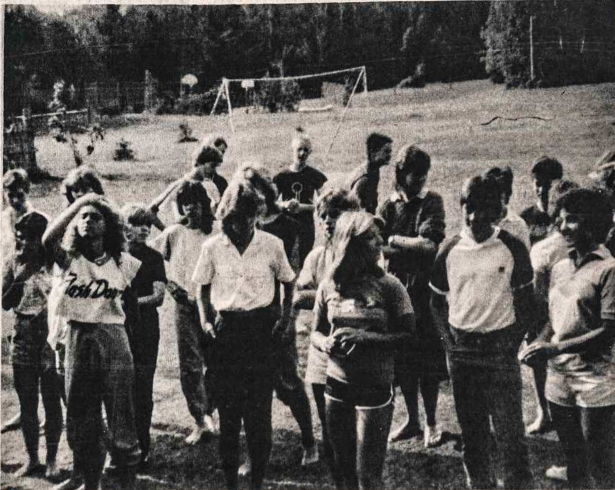
Jaunimas 17 m. ir studentai suvažiavo iš 12 valstybių lietuviškoje, krikščioniškoje dvasioje praleisti dvi savaites "Neringoje". Šių metų jaunuolių stovykla vyks birželio 15-28. Informacijai: Neringa, ICC, Putnam, Conn. 06260.