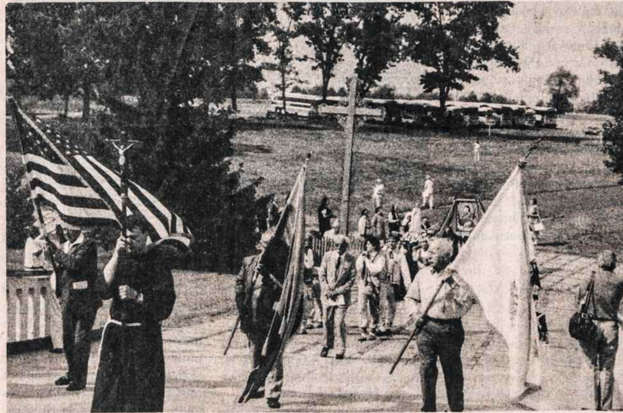
Vaidas iš maldų dienos už Lietuvą, Doylestown, Pa. Maldos diena buvo birželio 14. Ji buvo aprašyta Darbininke birželio 27, nr. 25, 5 psl. Priekyje vienuolis neša kryžių, už jo nešamos Amerikos, Lietuvos ir Lietuvos vyčių vėliavos, toliau nešamas lietuviškas aukštas kryžius, šv. Kazimiero paveikslas.