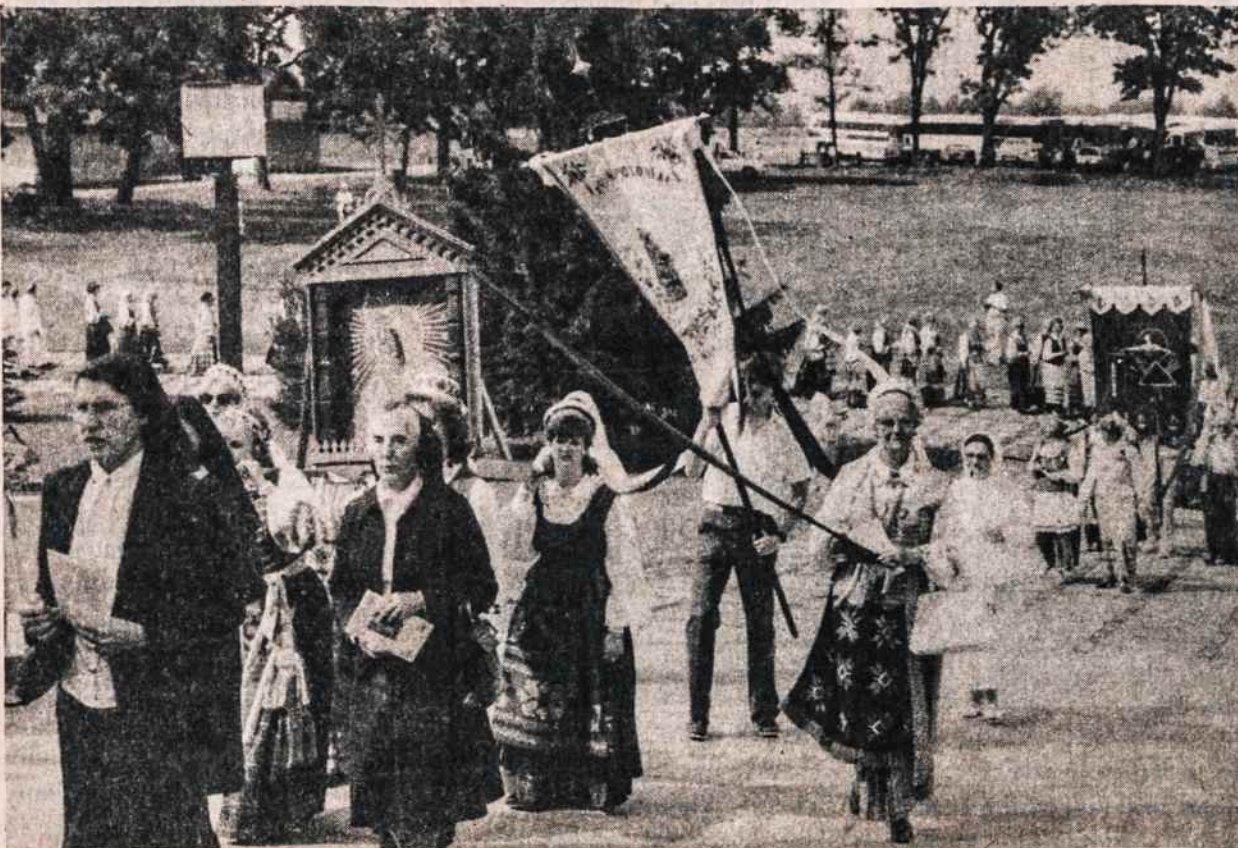
Birželio 14 Doylestown, Pa., buvo surengta maldos diena už Lietuvą. Procesijoje eina vienuolės, nešamas Aušros Vartų altorėlis ir kitos vėliavos.