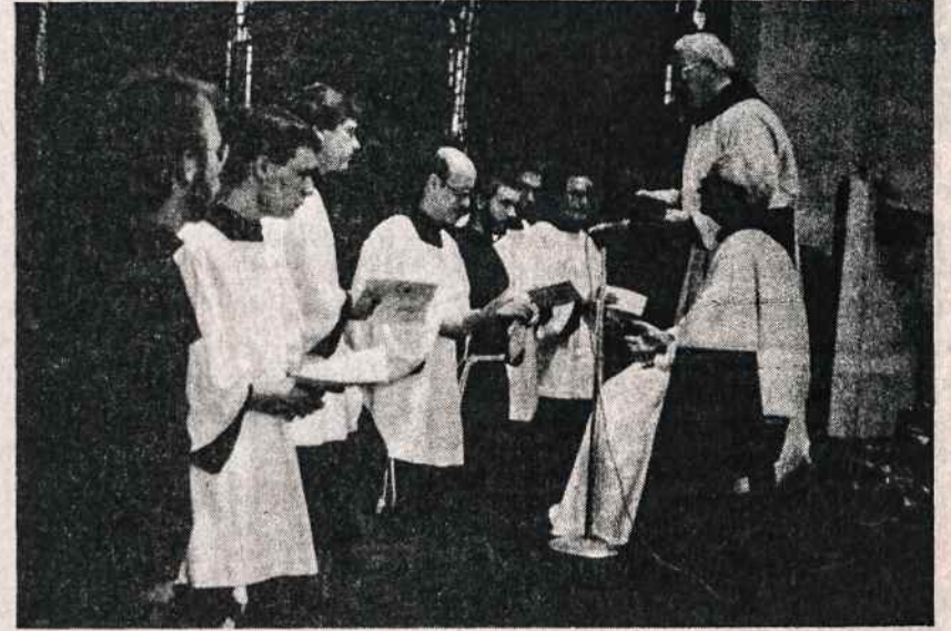
Kennebunkport, Maine, lietuvių pranciškonų vienuolyne 7 klierikai atnaujina vienuolinius įžadus.

Paskutinių kelių metų ateitininkų sendraugų stovyklos Kennebunkporte organizatorius ir programos parengėjas yra