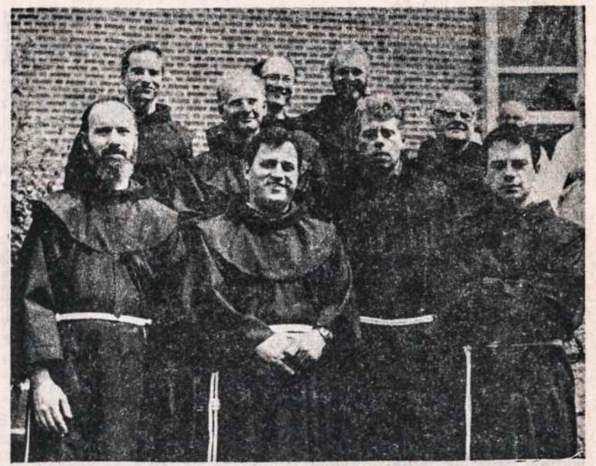
8 jaunuoliai ir 1 diecezinis kunigas apvilkti abitu pradeda noviciatą.

"Spindulys", Los Angeles Jaunimo tautinių šokių ir dainų ansamblis, po sėkmingų gastrolių šią vasarą Pietinėje Amerikoje, laimingai sugrįžo į namus, pars-