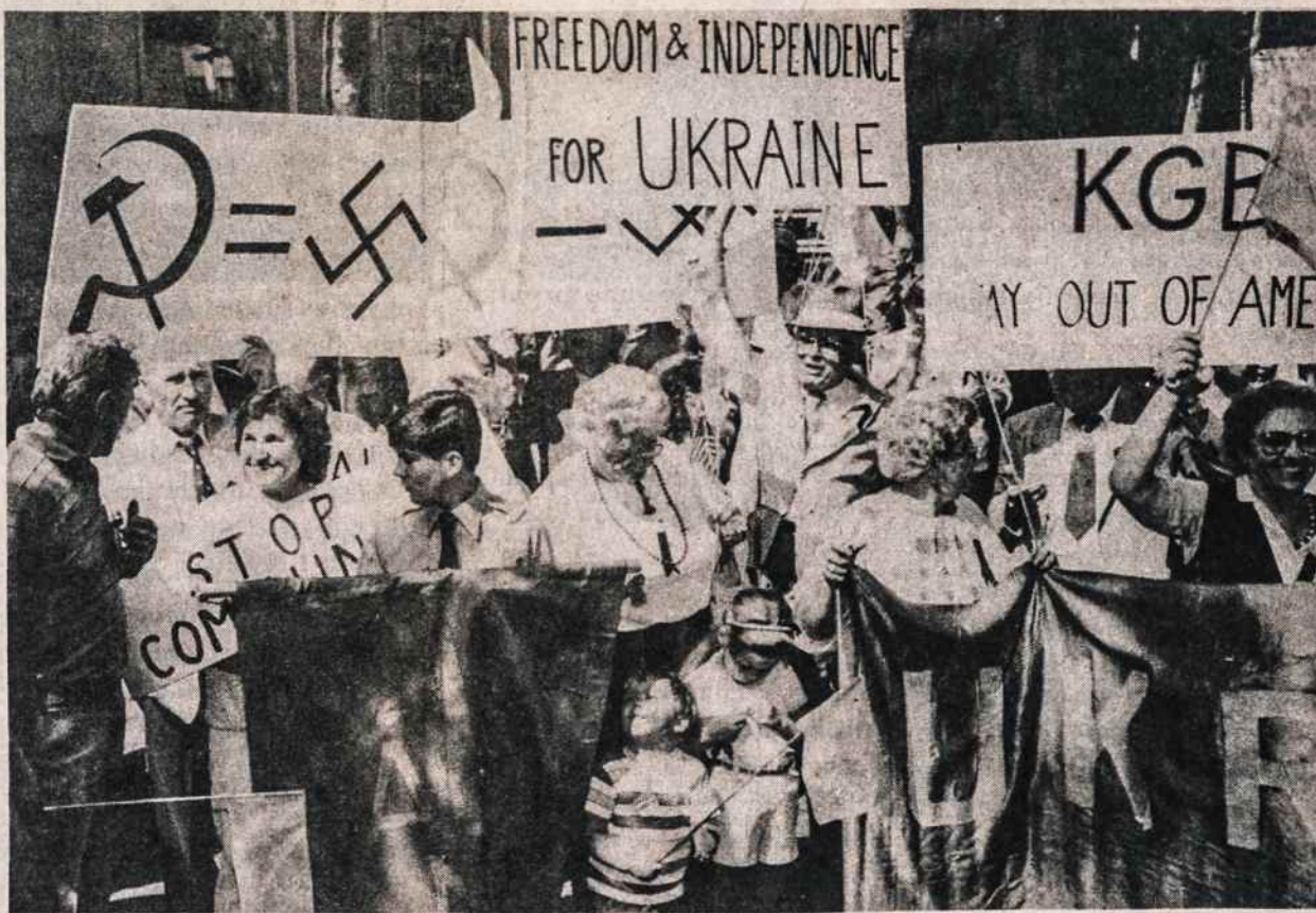
Demonstracijos prie Jungtinių Tautų rugpjūčio 23, prisimenant Stalino ir Hitlerio susitarimus, kuriuos pasirašė užsienio reikalų ministrai Molotovas ir Ribbentropas 1939 rugpjūčio 23 Maskvoje. (Aprašymą žiūr. 8 psl.)