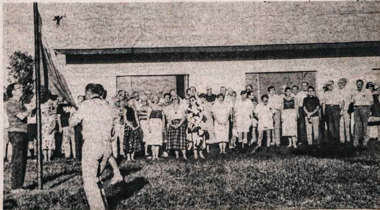
Vėliavos nuleidimas Lietuvių Fronto Bičiulių studijų savaitėje Dainavoje.