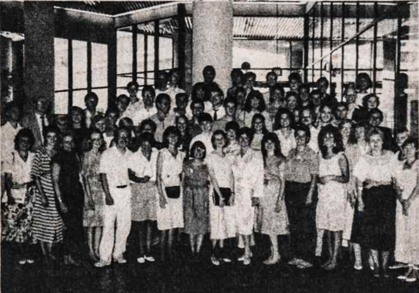
Jaunimo Sąjungos rengto politinio seminaro dalyviai Washington. Seminaras įvyko liepos 18 - 20. Jo aprašymas buvo išspausdintas Darbininke 31 ir 32 numeriuose.