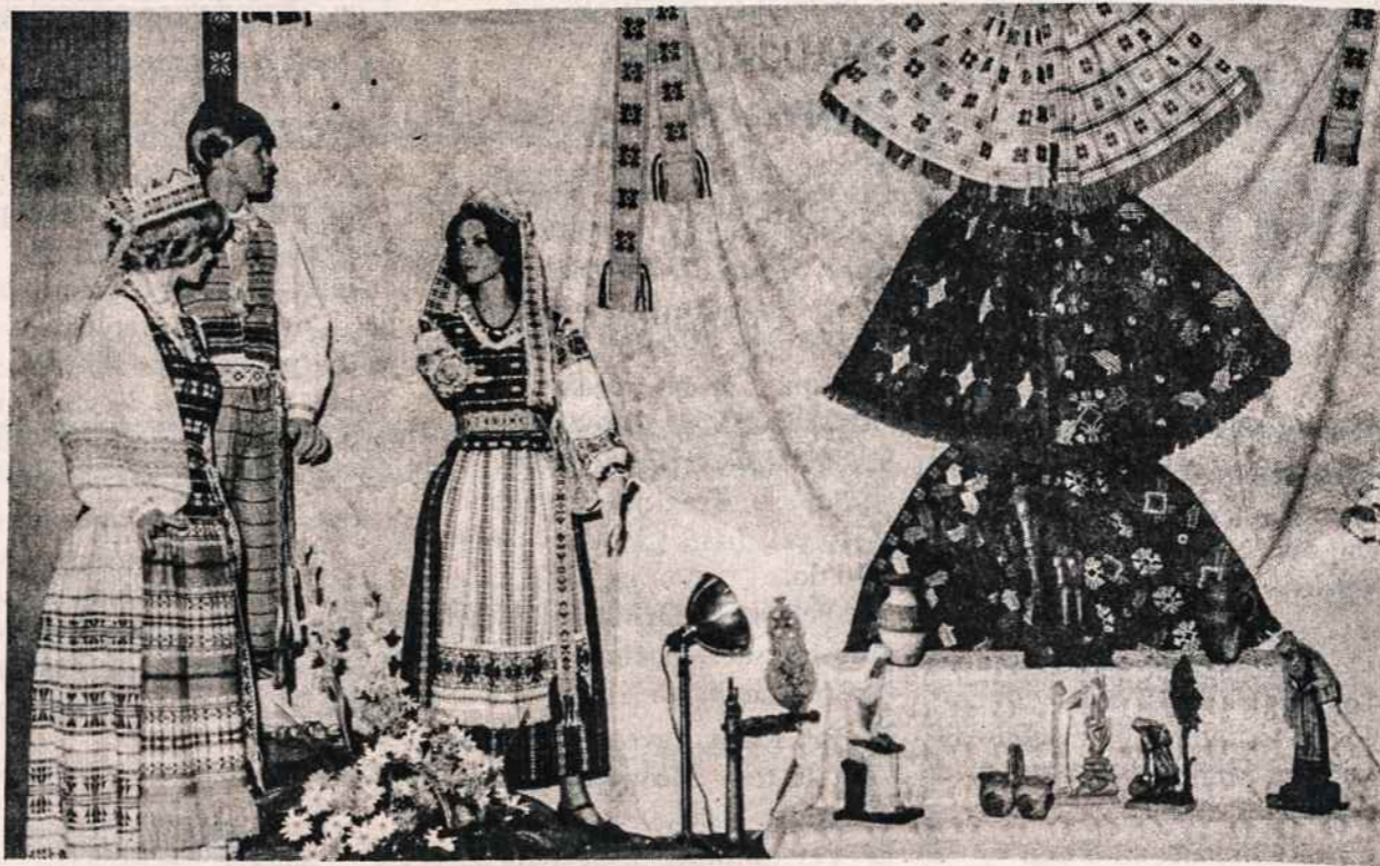
Įvairių įvairiausių audiniai, medžio drožiniai. Tai Liet. Tautodailės Instituto Toronto skyriaus darbai, kuriuos matysime tautodailės parodoje spalio 18 - 19 Kultūros Židinyje.

Dvidešimatmečio proga iškilmingas banketas įvyko rugsėjo 12 penktadienį Jungtinėse Tautose, diplomatų valgomajame. Dalyvavo apie 100 svečių. Tarp lietuvių buvo kun. Kazimieras Pugevičius, Audra ir Asta Lu-