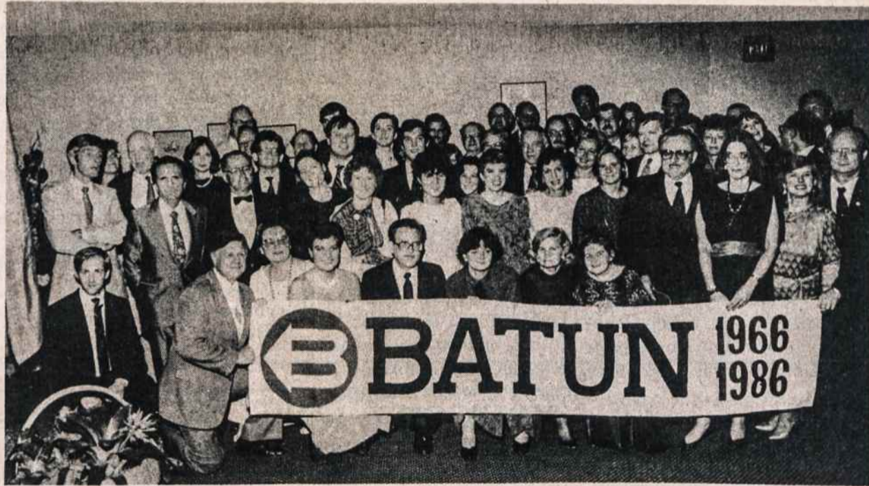
BATUNo 20 metų sukaktuviniame baliuje, kuris buvo š.m. rugsėjo 12 Jungtinių Tautų rūmuose.