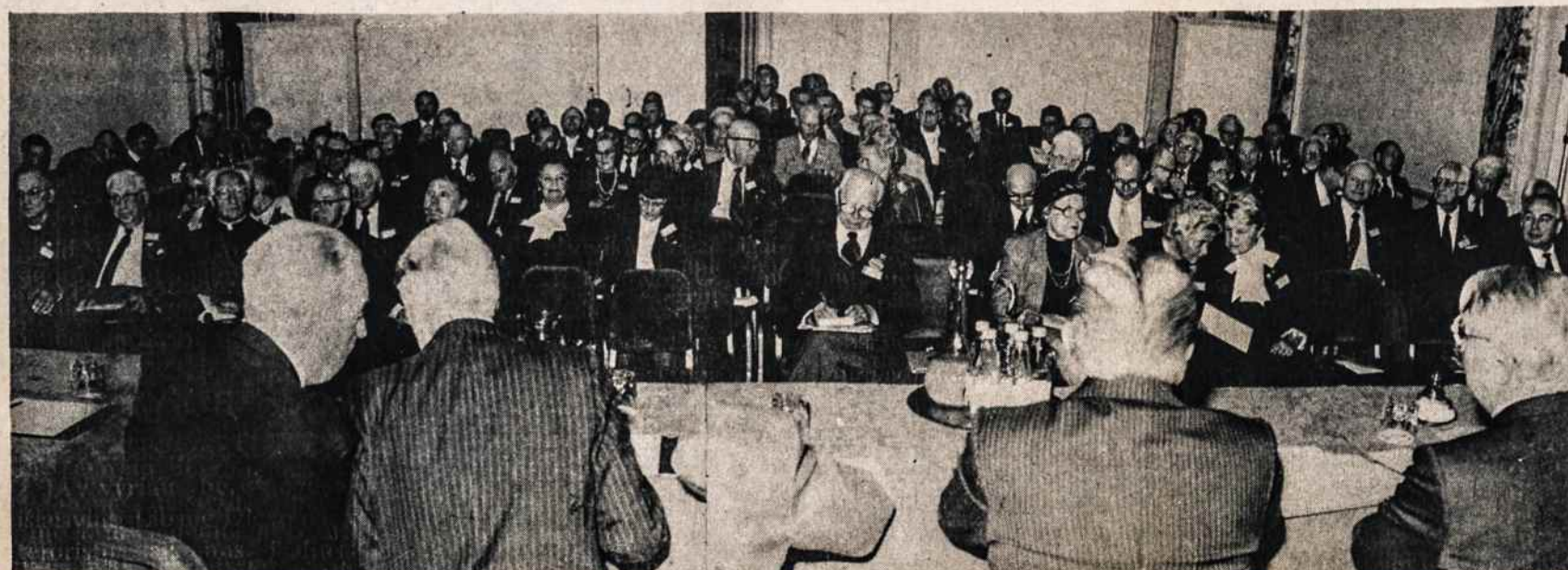
Vliko seimas vyko Londone, Russell vieubutyje, lapkričio 8 d. Nuotraukoje seimo dalyviai, kurių buvo apie šimtas.

VYTIS INTERNATIONAL TRAVEL SERVICE 2129 KNAPP STREET BROOKLYN, N.Y. 11229 TEL.: 718 769 - 3300