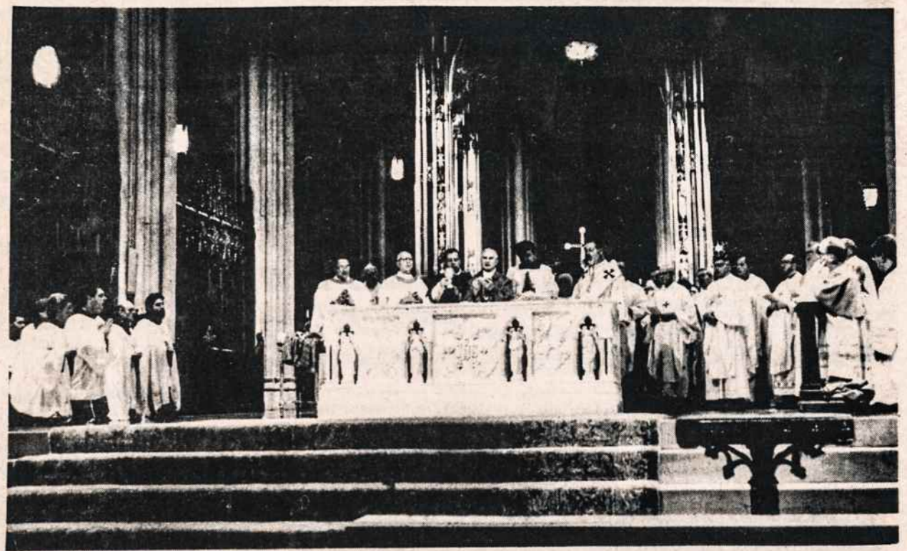
Iškilmingos pamaldos Šv. Patriko katedroje spalio 25 Liet. Religinės Šalpos 25 metų sukakties minėjimo metu. Pakilėjimo momentas. Prie altoriaus vyskupai, už jų sustoję pamaldose dalyvavę kunigai.

Tiek solistė, tiek pianistė buvo palytėtos gausiais publikos aplo-