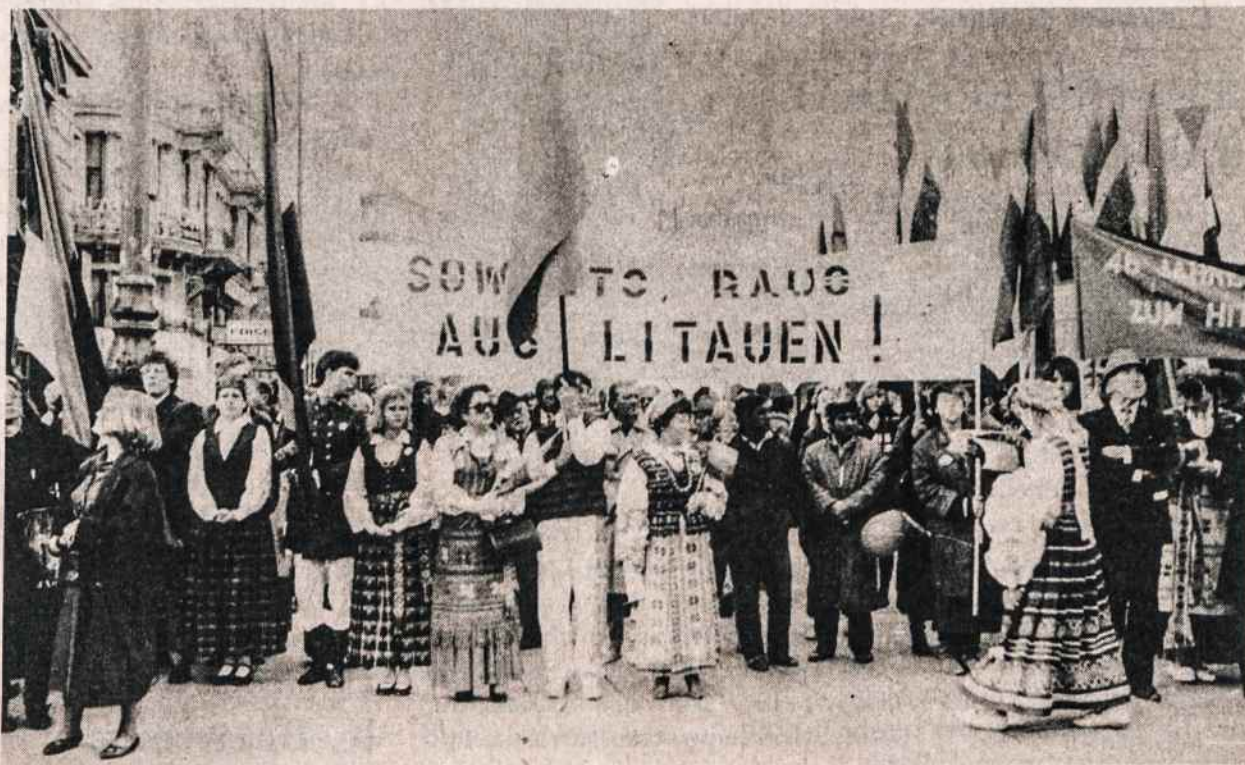
Demonstracijos Vienoje, Austrijoje. Nešamas plakatas su įrašu: Sowiets raus aus Litauen! — Sovietai lauk iš Lietuvos.