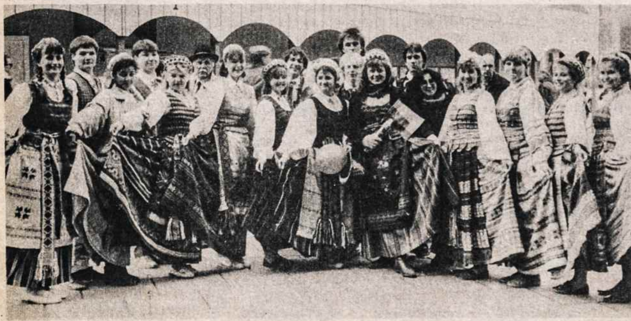
Vienoje, Austrijoje, kur vyko tarptautinė konferencija Helsinkio aktams peržiūrėti, lapkričio 4 demonstravo pabaltiečiai, tautinius šokius šoko Vasario 16 gimnazijos mokiniai.