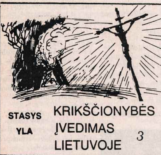
STASYS YLA KRIKŠČIONYBĖS ĮVEDIMAS LIETUVOJE 3

Visa jos kultūra rėmėsi dar gana primityviais žemės ūkiu, prekybos ir karinės civilizacijos elementais. Tiesa, vėlesniame laikotarpyje Lietuvai pasinešus militarine kryptimi, mūsų karinė civilizacija pasižymėjo jau sumaniai ir gerai įrengtomis pilimis, kulgrindomis, geru apsiginklavimu. Tačiau kuo daugiau mes galime pasigirti? Nebent liaudies menu — dainomis, skulptūra, kurie tačiau tėra buvę daugiau primityviosios kultūros liudininkai.