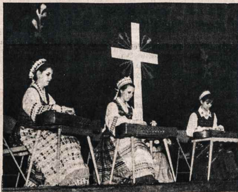
Trys sesutės Gelažytės atlieka programėlę Šv. Jurgio parapijoje per iškilmingus pietus, kai ten lankėsi vysk. P. Baltakis, OFM.

Spinduliuoja ir jo lietuviškumas ir ragina visus ne tik išlaikyti lietuviškumą, bet jį dar padidinti, sustiprinti, išugdyti, kad vėl būtų atstatyta senoji garbė, kad vėl jo karstas būtų sugrąžintas į jo vardo koplyčią, o jo vardo bažnyčioje Vilniuje vėl skambėtų varpai, šaukdami visus maldai.