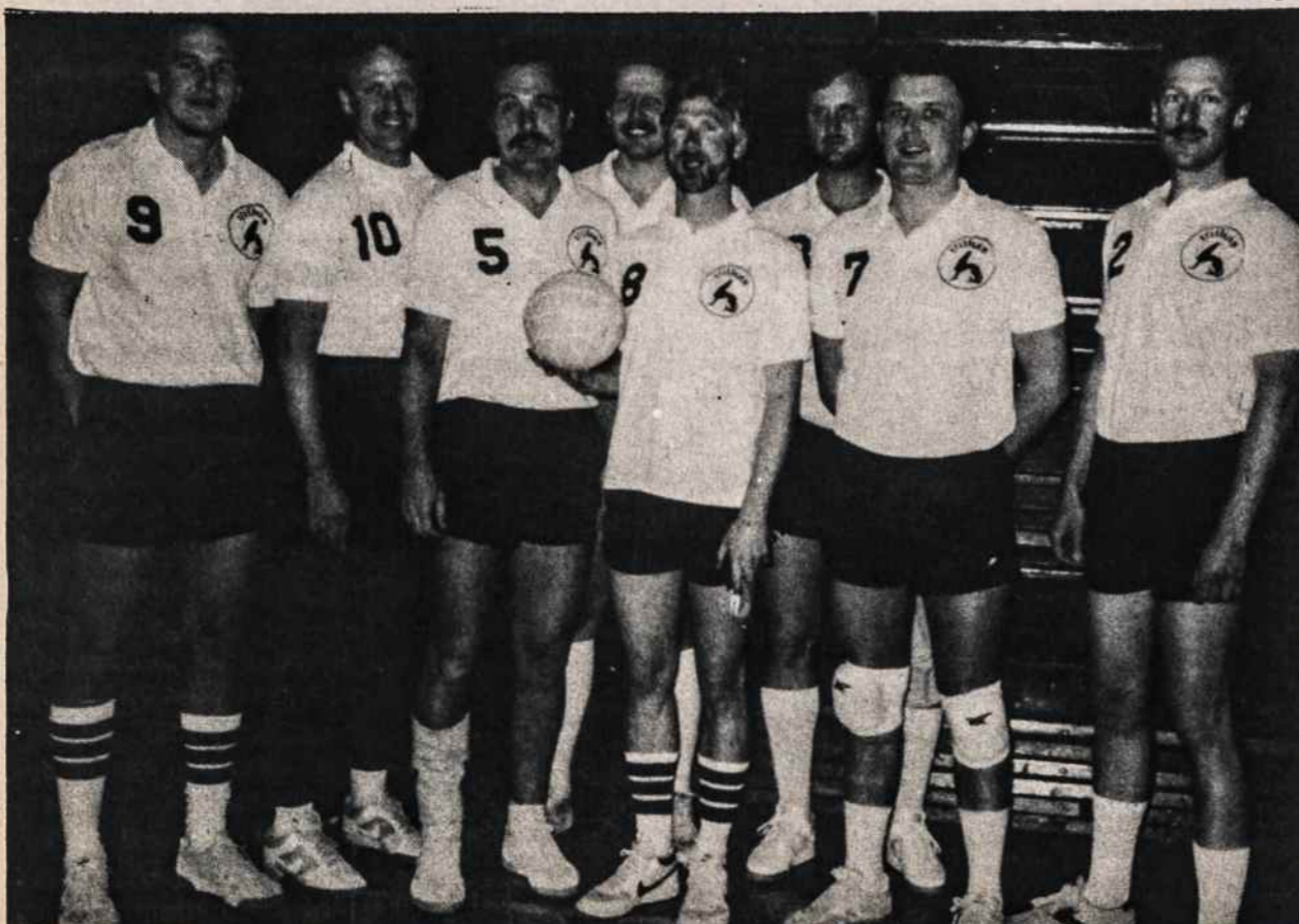
Baltimorės Lietuvių Atletų Klubo vyrų tinklinio komanda šiais metais laimėjo pirmą vietą Baltimorės miesto A klasės turnyre. Jie dalyvaus gegužės 16 - 17 rytų apygardos žaidynėse New Yorke.

VYTIS INTERNATIONAL TRAVEL SERVICE 2129 KNAPP STREET BROOKLYN, N.Y. 11229 TEL.: 718 769 - 3300