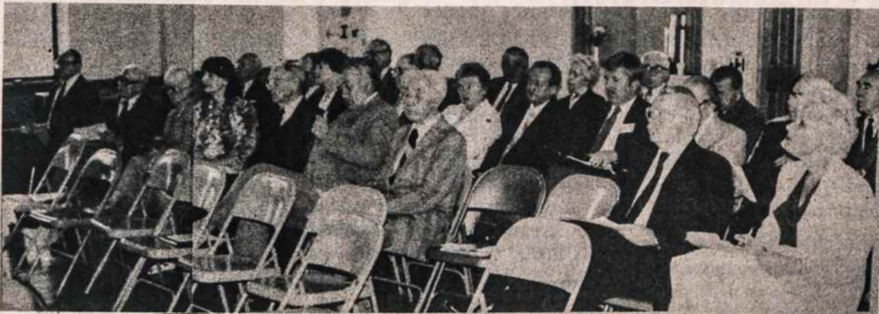
Lietuvių Bendruomenės darbuotojų suvažiavimas New Britain, Conn., įvykęs gegužės 2. Nuotr. tėv. Pranciškaus Giedgaudo, OFM.