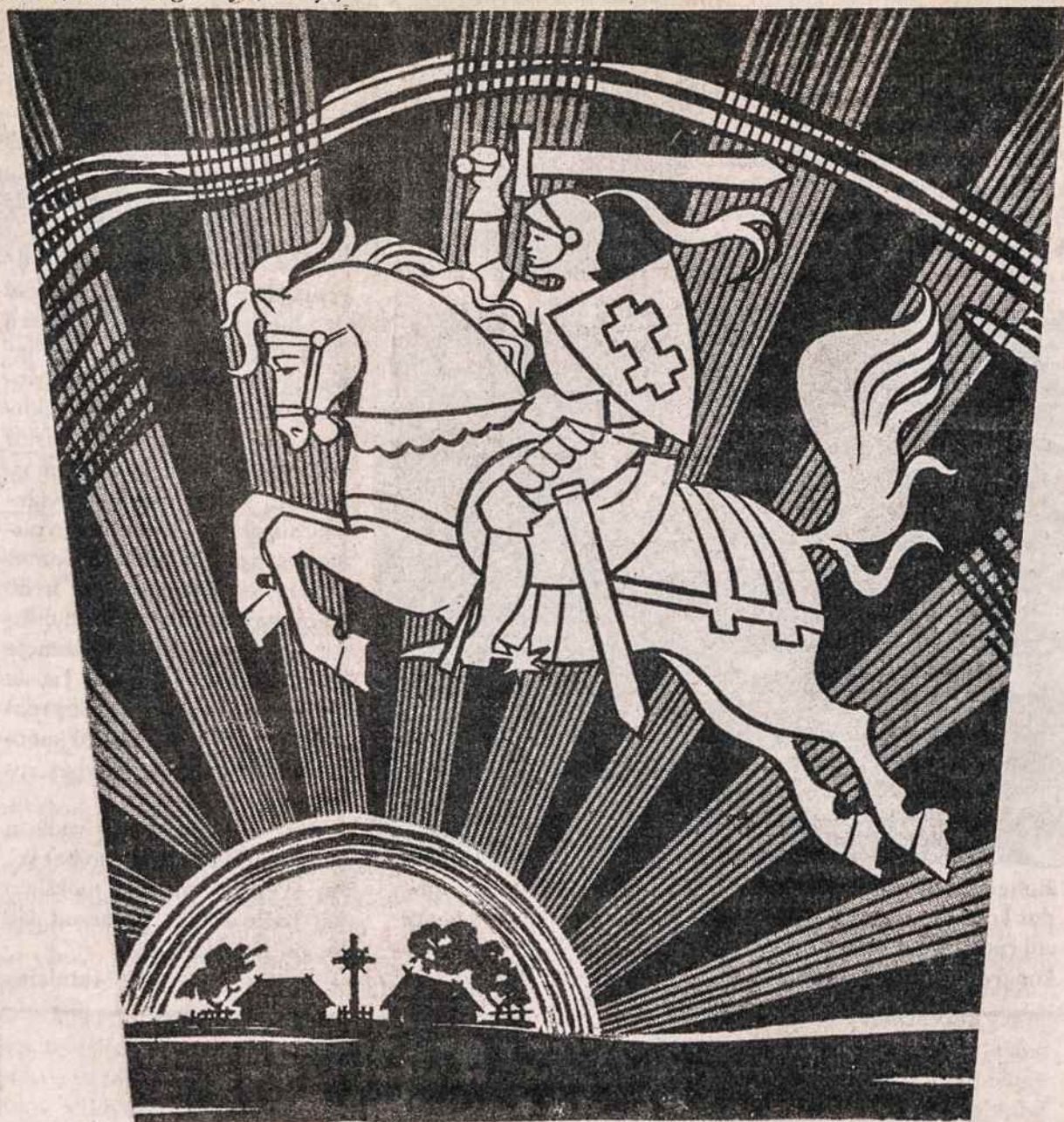
Iš Lietuviško kaimo spinduliavo lietuviškoji kultūra. Iš to kaimo kilo ir tautinis mūsų atbudimas. Ta gyvoji Lietuva, prieš 70 metų paskelbusi, kad atstato savo nepriklausomybę, ir dabar kviečia mus visus vieningai dirbti jos labui ir jos išlaisvinimui.