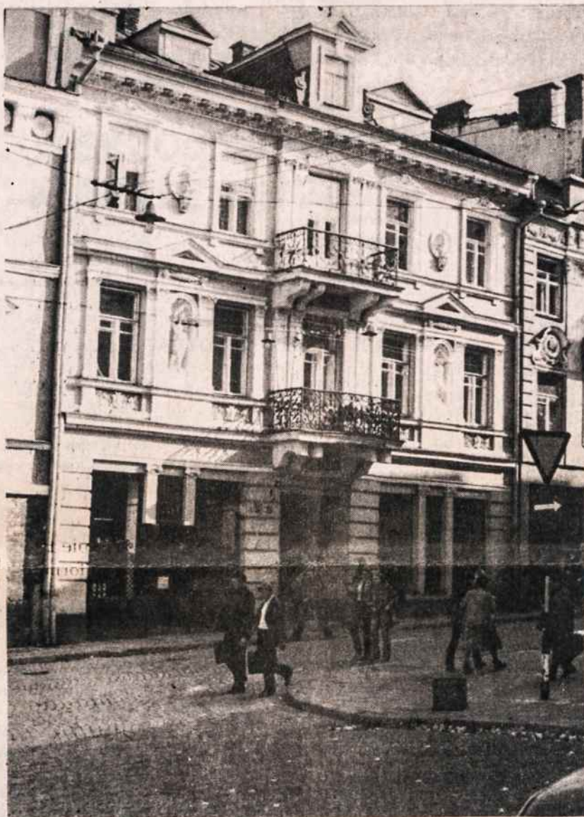
Namas, kur prieš 70 metų pasirašyta Lietuvos nepriklausomybės paskelbimo aktas. Šis namas yra Vilniuje, Pilies gatvėje netoli Šv. Jono bažnyčios ir universiteto. To namo antrame aukšte buvo Lietuvos Tarybos būstinė. Čia ir posėdžiavo Lietuvos Taryba 1918 metais vasario 16, šeštadienį, labai šalta dieną. Aktas buvo pasirašytas 12:30 v. popiet. Visiems tarybos nariams sustojus, nepriklausomybės paskelbimo aktą perskaitė dr. Jonas Basanavičius, seniausias Tarybos narys. Jis pirmas aktą ir pasirašė.

Visi kviečiami, visi laukiami, kad būtų mūsų balsas galingesnis ir mūsų auka didesnė!