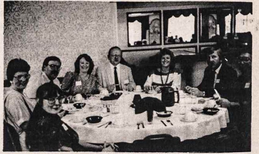
Iš LB Tarybos sesijos, — Connecticuto ir New Jersey atstovai.