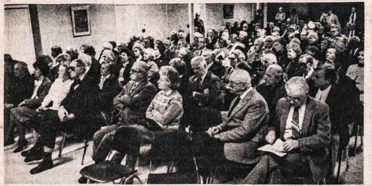
Publika politiniame simpoziume, kuris buvo Kultūros Židinyje sausio 24 d.

Ieškomas nedidelis butas dviejų asmenų šeimai prie gero susisiekimo, abu dirba. Skambinti darbo metu Darbininko redakcijai 718 827 - 1352.