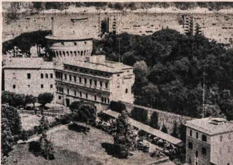
Vatikano radijas: jau 30 metų transliuoja programą ir lietuvių kalba.