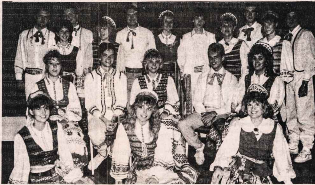
"Liepsnos" šokėjai ir šokėjos.