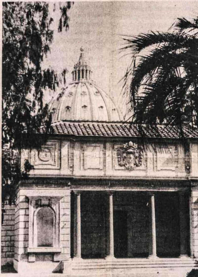
Popiežiškasis mokslo akademijos rūmų fasadas. Fone — Šv. Petro bazilikos kupola.