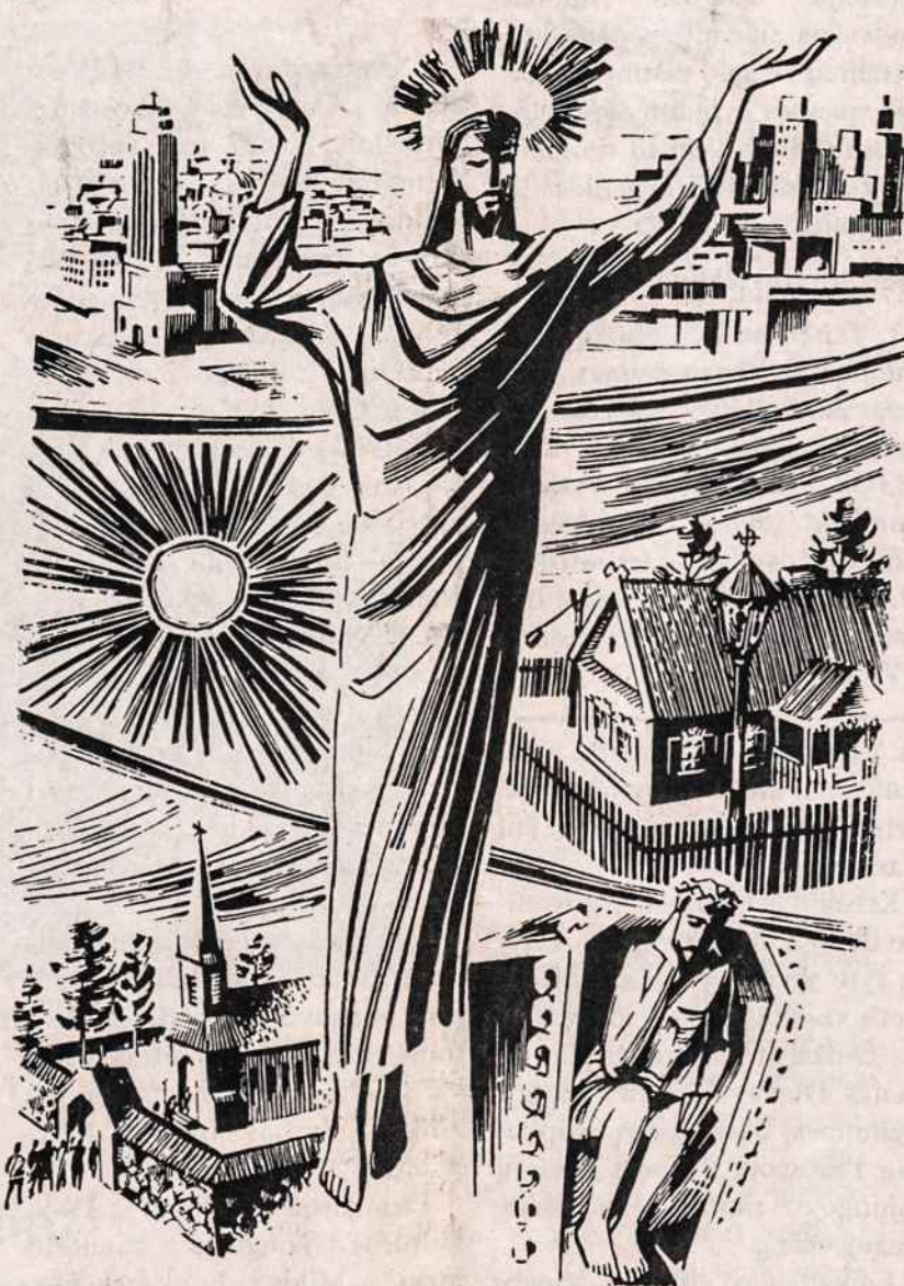
Dail. Alfonso Dociaus piešinys — Prisikėlimas.

Kristaus prisikėlimo šventės proga nuoširdžiai sveikiname mūsų vienuolyno geradarius, penktadienio ir ketvirtadienio parengimų bendradarbius, Lietuvių Kultūros Fondo valdybą ir visus Kultūros Židinio rėmėjus.