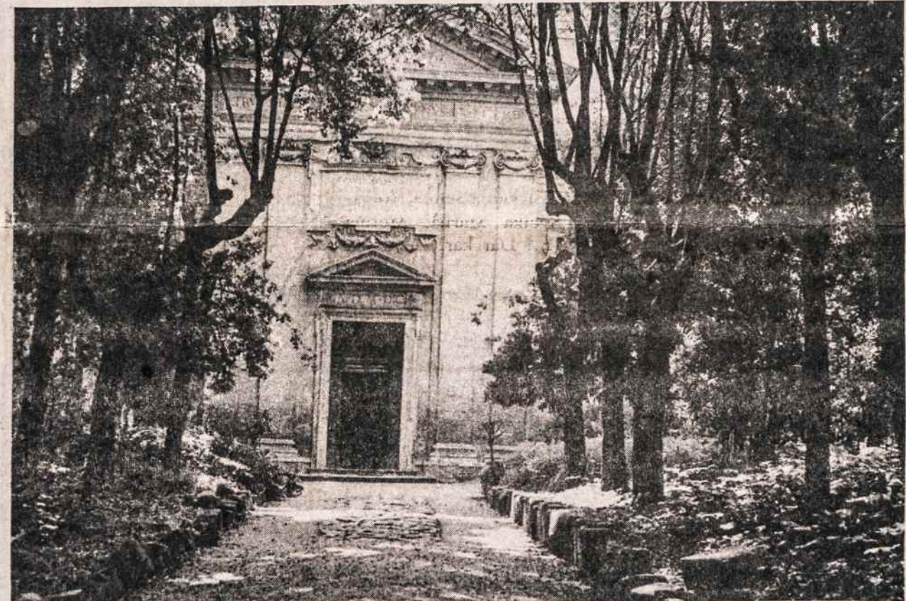
Šv. Pauliaus šventovė Tre Fontane sodelyje.