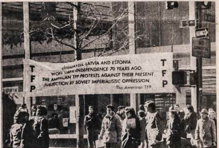
New Yorke vasario 17 buvo surengtos demonstracijos prieš Baltijos kraštų okupavimą. Rengė The American Society for the Defence of Tradition, Family and Property. Demonstracijos vyko labai judriame miesto kvartale 5 Ave., 42 St. prie miesto bibliotekos. Išdalinta 30 tūkstančių lapelių, kur kalbama apie dabartinę padėtį okupuotuose kraštuose ir reikalaujama laisvės.