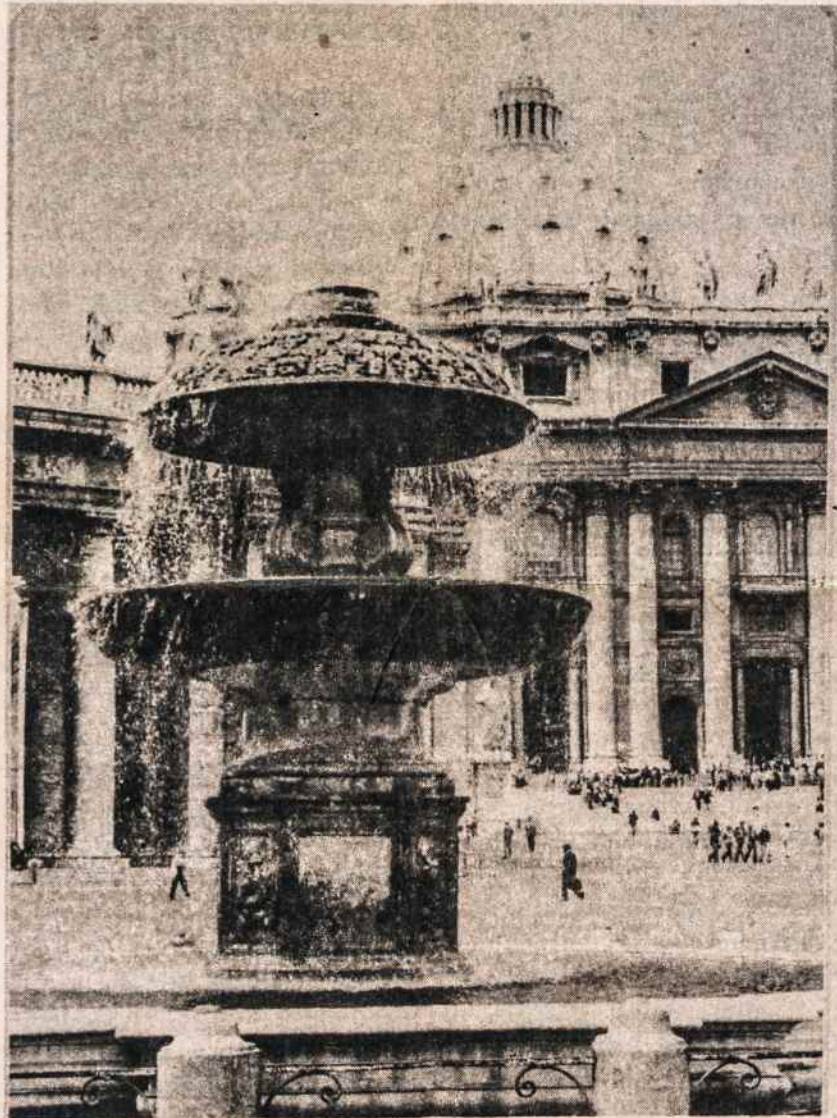
Šv. Petro bazilika Romoje.

Lietuviškoji knygelė skursta, reikia jai pagalbos, reikia net skubios pagalbos. Tad pagalvokime, kaip tai padaryti ir tuoj darykime!