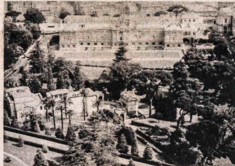
Vatikano paveikslų galerija — Pinacoteca ir Popiežiškosios Mokslo akademijos rūmai.

Birželis liūdo, suskaudino mus ir paliko amžiną pamoką — budėkime, visada budėkime, ieškokime draugų pas tuos, kurie irgi baiminasi savo didžiųjų kaimynų. Budėkime ir, nepamiršdami aukų, sunkiųjų laikų, mes visi tikime į tautos prisikėlimą, į nepriklausomybę.