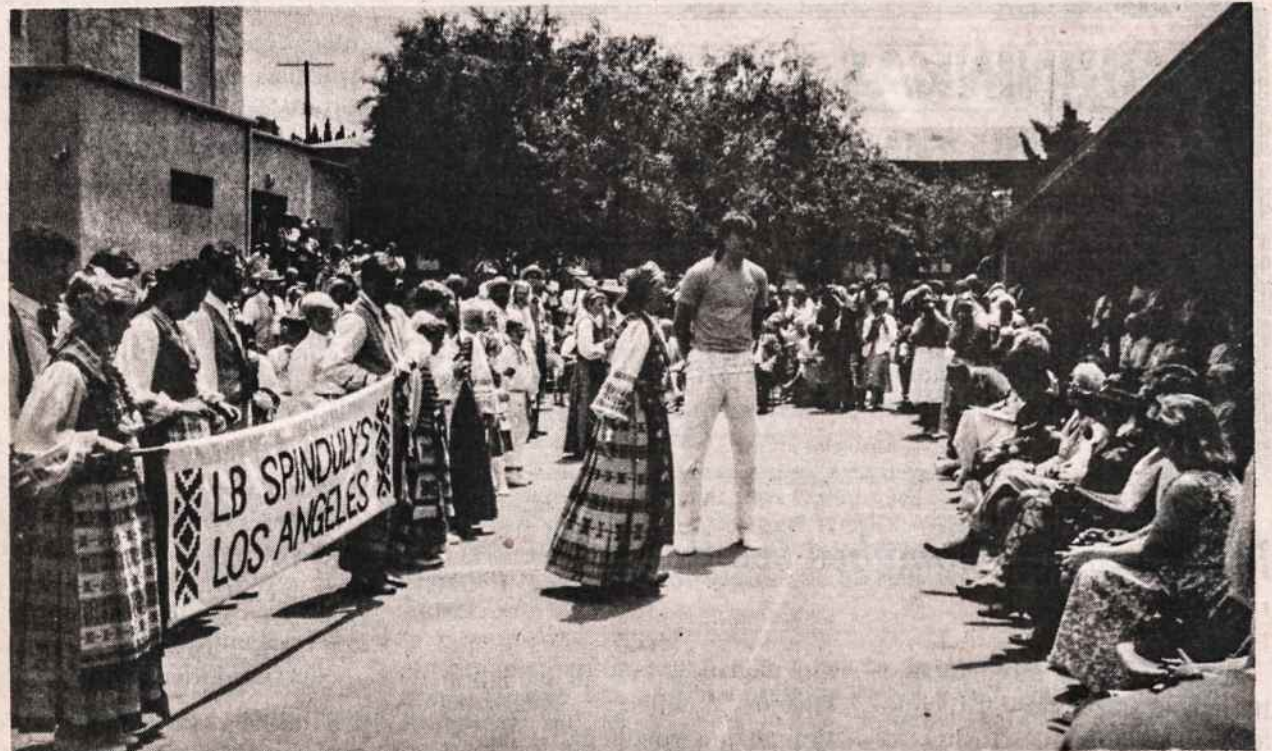
Arvydas Sabonis jaunimo šventėje Los Angeles gegužės 5. Šalia jo Spindulio vadovė D. Varnienė.