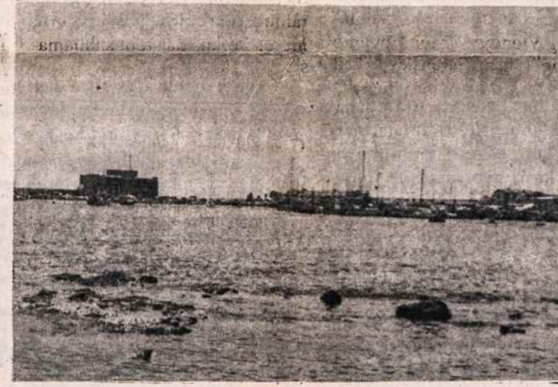
Paphos uostas. apaštalas Paulius šiame mieste laimėjo Kristui vietos valdytoją.

Sveikiname Liepos 4, sveikiname visas tautas, kurios čia, sudarydamos tautų mozaiką, siekia vieno tikslu — galingos Amerikos! Tegū Dievas laimina Ameriką, visų nuskriaustųjų paguodą!