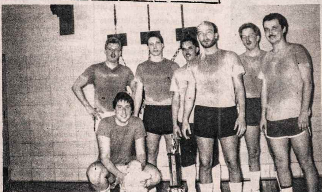
Š. Amerikos lietuvių sporto žaidynių vyrų krepšinio B klasės laimėtojai — Cicero "Ateitis" krepšininkai po finalo Chicago žaidynės.

AIDAI — vienas geriausių kultūros žurnalų išsivijoj. Ar juos prenumeruoti?