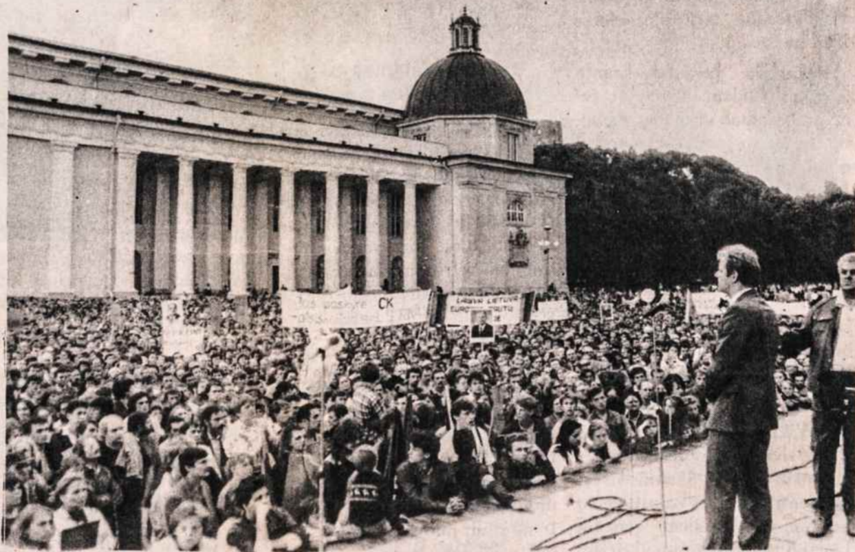
Demonstracijos Vilniuje, Gedimino aikštėje, birželio 24 d. Plakatai nukreipti prieš komunistinę valdžią. Pirmame plakate įrašyta: Gražinti Lietuvai pilietybę, antrame — Jus paskyrė CK — atsiskaitysite Lietuvai, trečiame — Laisva Lietuva Europos tautų šeimoje, kiti plakatai neišskaitomi, neižūrimi.

Visi trys jaunuoliai aktyviai dalyvavo patriotinėje veikloje. 1983 m. gegužės mėnesį jie taip pat nesėkmingai mėginę pabėgti į Suomiją. Jų pergyvenimai buvo išsamiai aprašyti savilaidinės Aušros 1985 m. gruodžio numerio. Jie buvo terorizuojami ir kalinami psichiatrinėje ligoninėje. Nukentėjo ir jų giminės. Po prievartinės karinės tarnybos jiems buvo uždrausta studijuoti. Elta