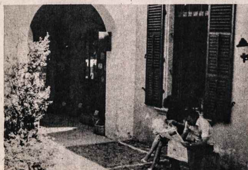
Licosia — Kipro sostinė. Ramus kampelis neramiame mieste.

Kipriečiai dėjo pastangas būti savivaldi Bendrijoje. Antiochijos patriarchas Aleksandras 410 m. skundėsi laiške popiežiui Inocentui I, kad kipriečiai šventina savo vyskopus, priešindami šventiną Nicėjos Susirinkimo potvarkui, kad tik Antiochijos patriarchas turi teisę skirti ir šventinti Kipro arkivyskupą. Popiežius laišku liepė kipriečius paklusti šiam potvarkiui. Tačiau atsakymo iš kipriečių nesulaukė. Jie ir toliau darė savo, teigdami, kad Kipro bendrija yra savivaldi, nes turi savo šventąjį apaštalą Barnabą.