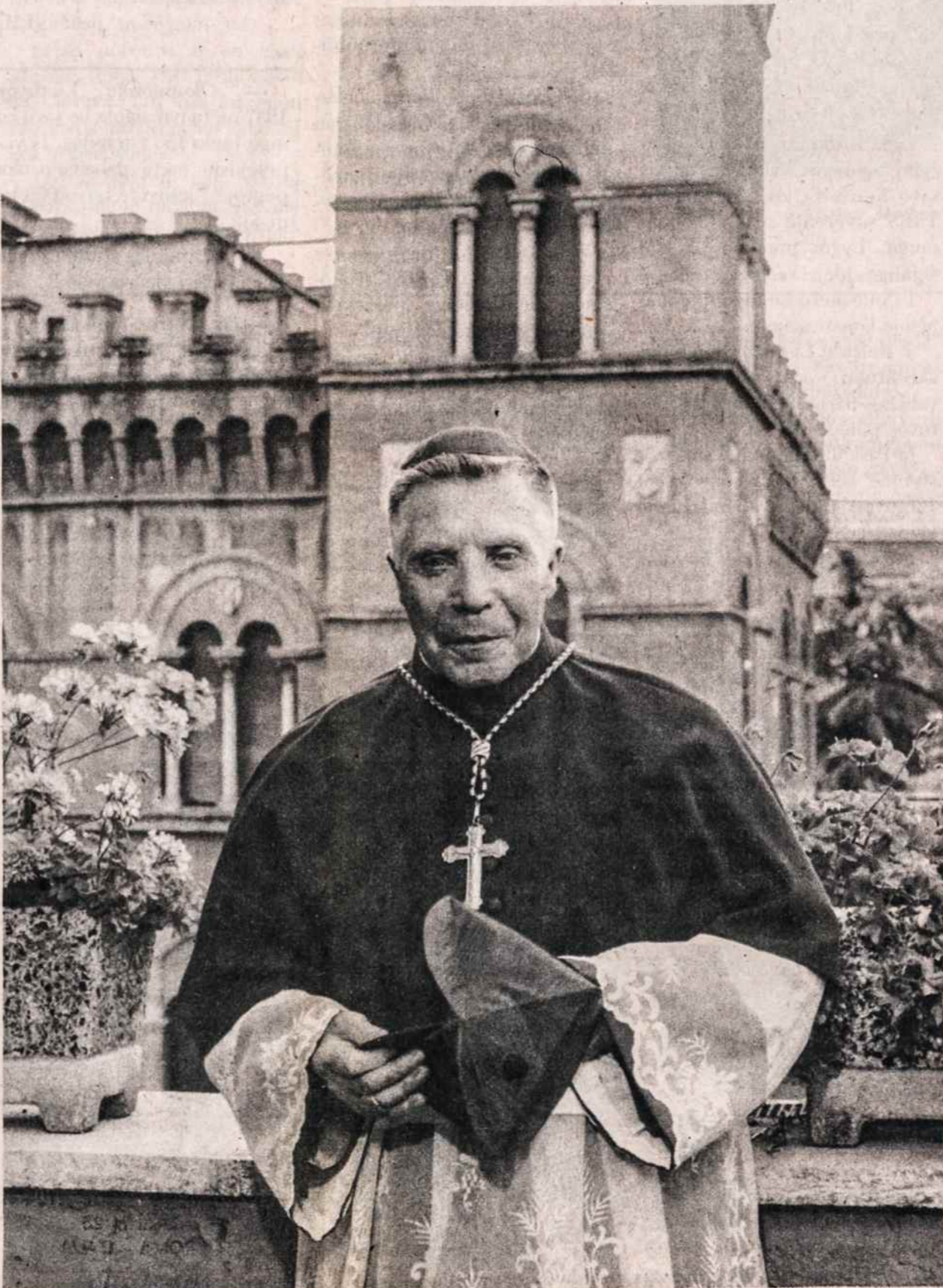
Kardinolas Vincentas Sladkevičius Romoje, Lietuvių Šv. Kazimiero kolegijos balkone.