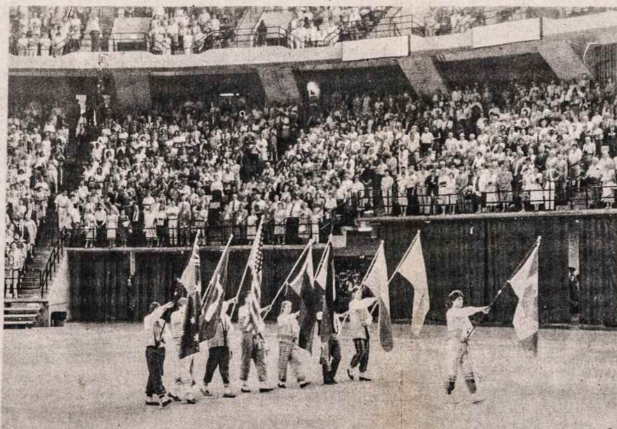
VIII tautinių šokių šventės metu nešamos tautinės vėliavos tų kraštų, kurių lietuviškos tautinių šokių grupės dalyvavo šventėje. Priekyje nešama Kanados vėliava, nes šventė vyko Kanadoje.

VYTIS INTERNATIONAL TRAVEL SEŪVICĖ 2129 KNAPP STREET BROOKLYN, N.Y. 11229 TEL.: 718 769 - 3380