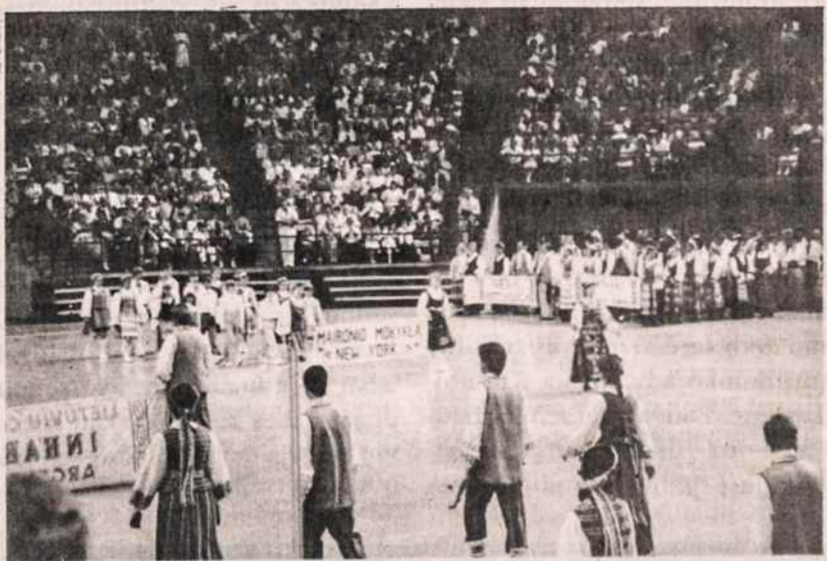
Į tautinių šokių šventės areną ateina N.Y. Maironio lietuvištinės mokyklos šokėjai. Nuotr. K. Miklo