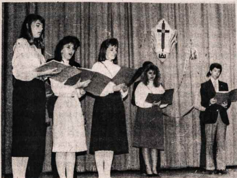
Clevelando moksleiviai ateitininkai atlieka programą ateitininkų metinėje šventėje.

AIDAI — vienas geriausių kultūros žurnalų išėjimų. Ar juos prenumeruoti?