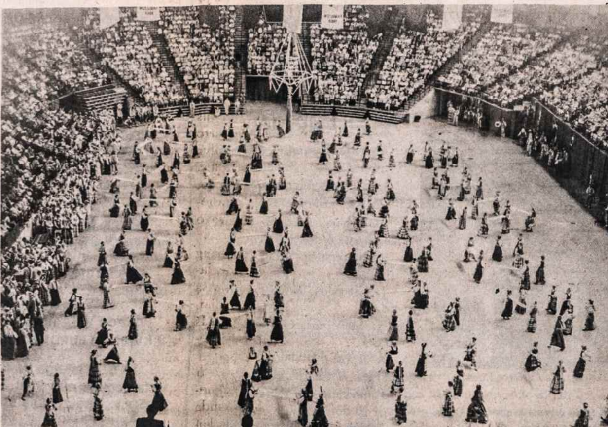
VIII-toje tautinių šokių šventėje Hamiltone.