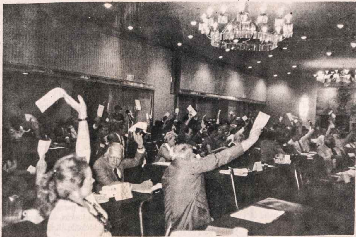
VII-tojo PLB seimo dalyviai balsuoja.