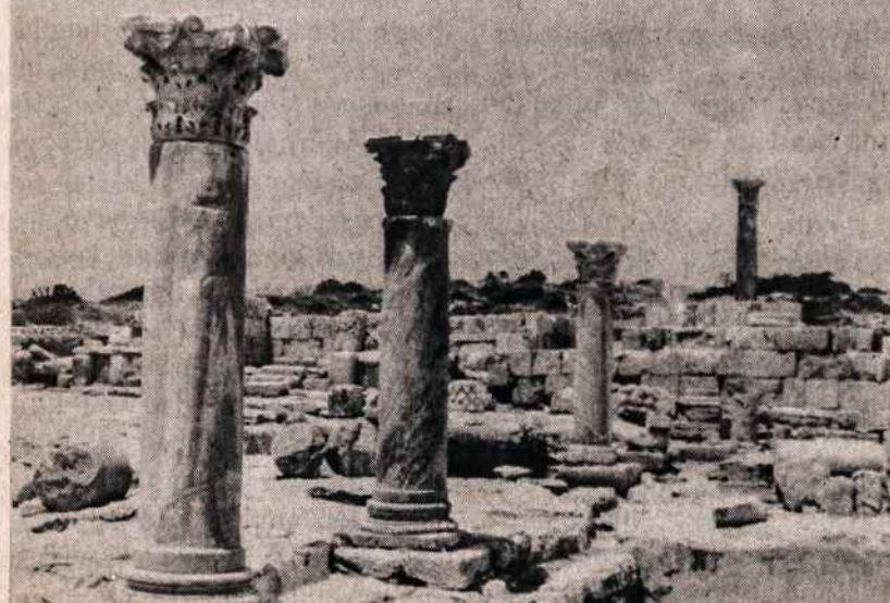
Kurionas. Apolono šventovė.

Keo-kebab šeimininkas atneša alaus ir man ir sau. Jis mėgsta