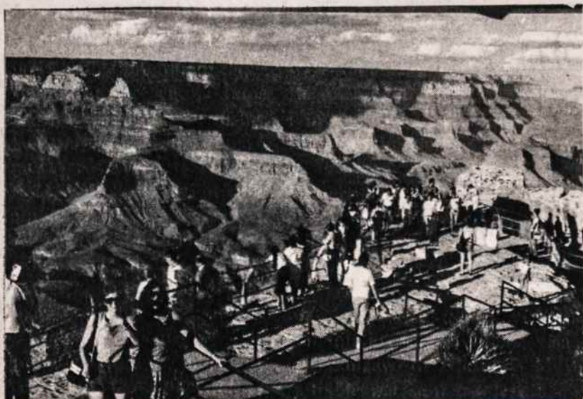
Grand Canyon kalnuose, Arizonos valstijoje, ekskursuoja Vyties agentūros suorganizuota grupė. Priekyje Audronė Gudaitė ir Dalia Bulgarytė.