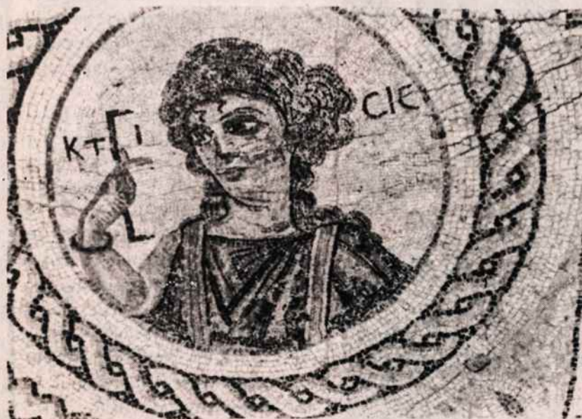
Kurionas. Ktisis — Kūrimas vaizduoja kūrėją — dievą kaip moterį su matuokle.

Gegužės 12-ąją Ričardas atš-ventė savo vestuves su Barenge-rija Limasolio pilies koplyčioje, apvainikuodamas jaunąją Angli-jos karalienės kartūna. Sekančią dieną Limasolį pasiekė ir atsili-kusioji Ričardo flotilė.