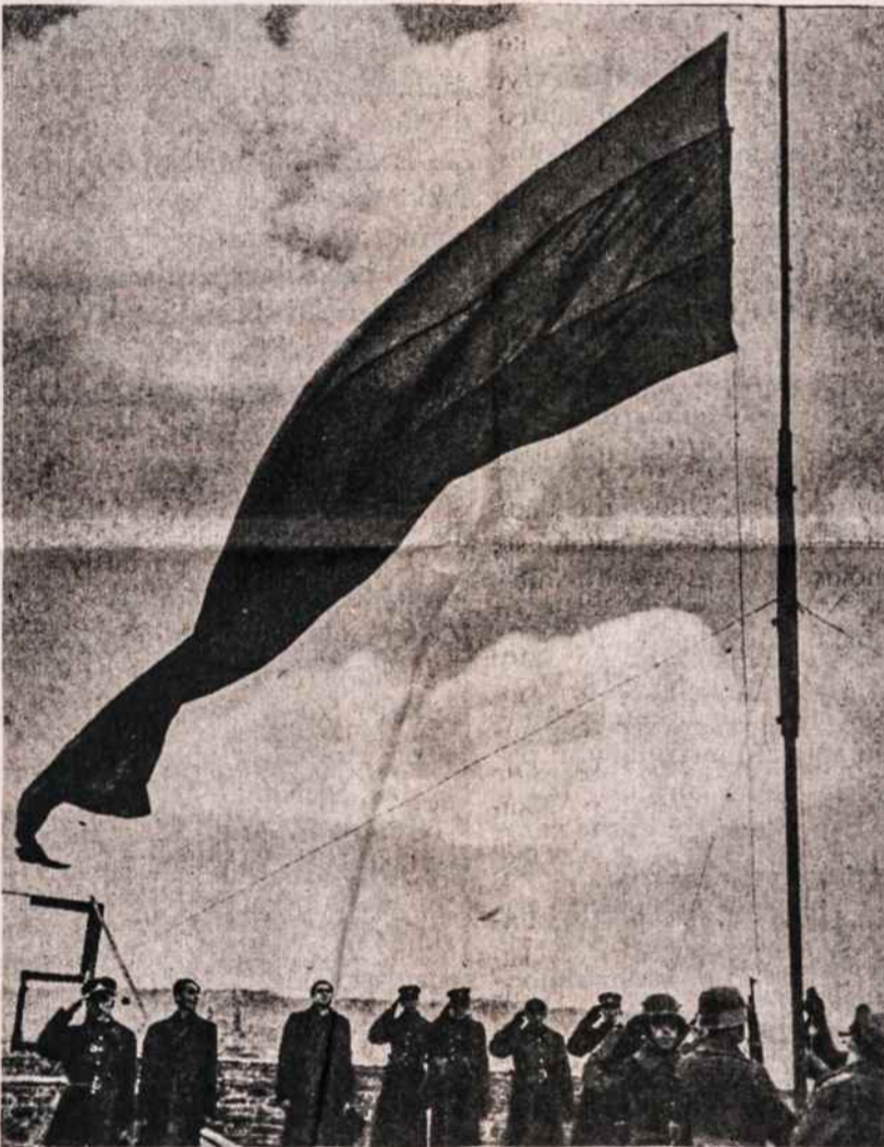
Iškeliama trispalvė vėliava Gedimino pilies bokšte Vilniuje 1939 spalio 29 d.

Džiaugdamiesi tuo, kas krašte pasiekta, vis dėlto neužmirš-kime ir to fakto, kad kraštas tebėra okupuotas. Todėl ir nuk-reipkime žvilgsnius į vėliavą Ge-dimino pilies bokšte ir visom pa-stangom siekime pavergtai tau-tai nepriklausomybės!