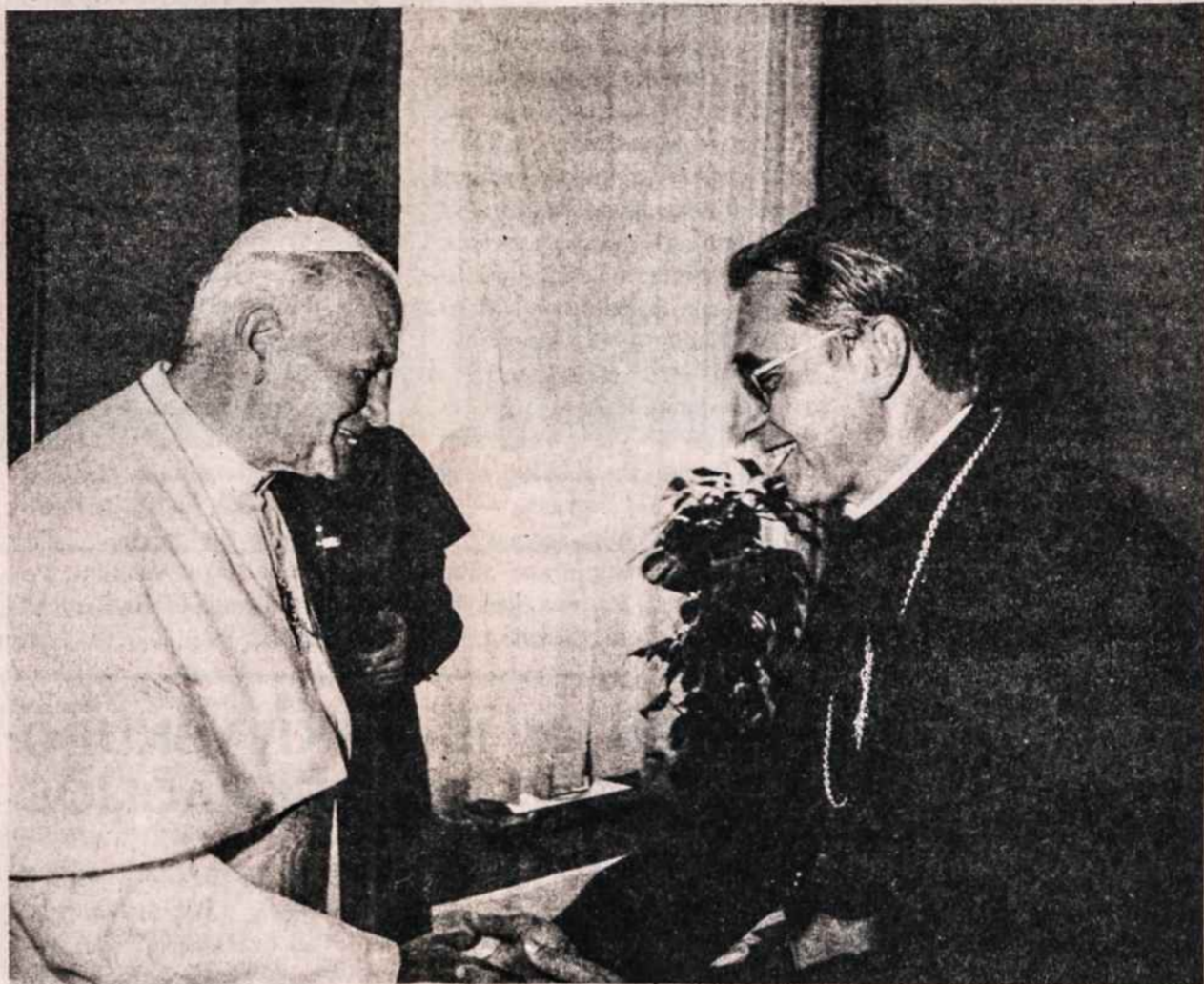
Popiežius Jonas Paulius II sveikinas su naujai konsekruotu arkivyskupu Audriumi Bačkiumi spalio 5 privačioje audienijoje, kada buvo priimti iškilnėse dalyvavę lietuviai vyskupai.

Vilkaviškis. 1987 m. kovo 6 d. grupė saugumiečių, nepasiskiusių savo pavardžių, padarė kratą Onos ir Jurgio Brilių gyvenamajame name, Vilkaviškio mieste, Vilniaus Nr. 30. Kratos (nukelta į 2 psl.)