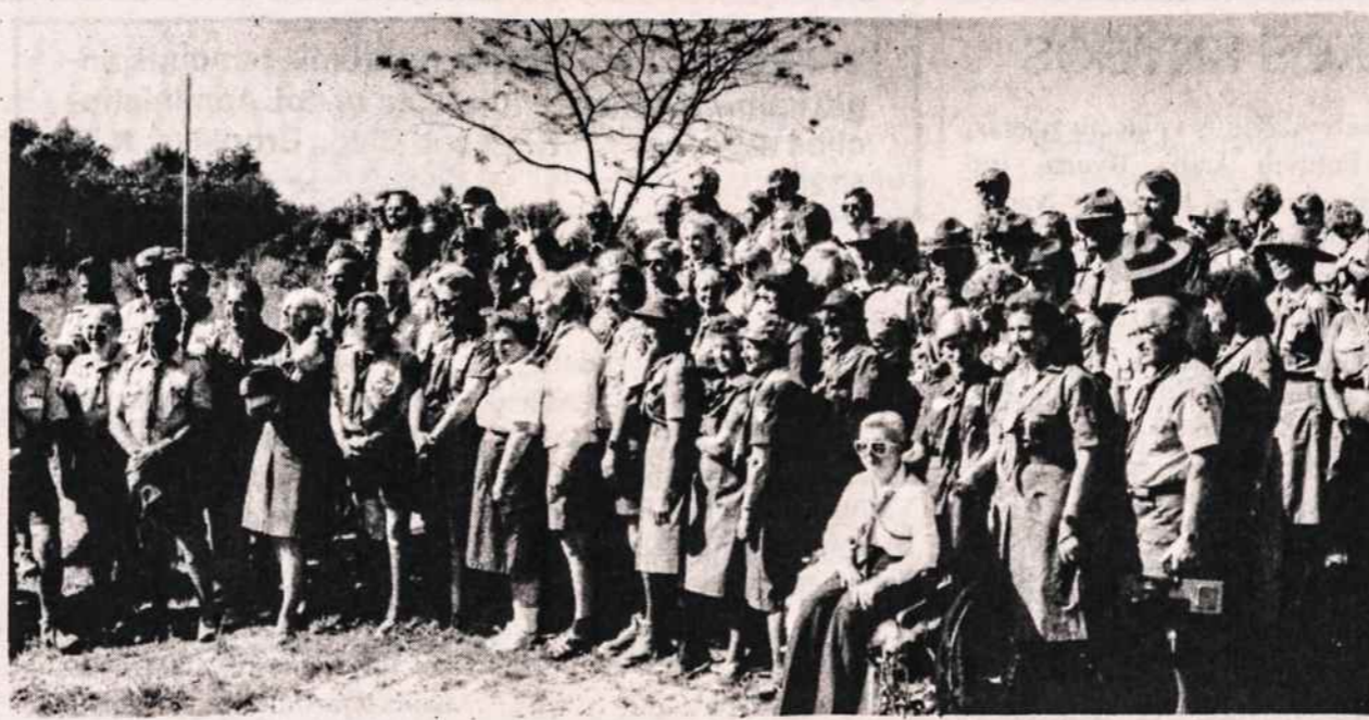
Svečių diena 7-toje tautinėje skautų stovykloje.

Rėmėjos ir jų talkininkės paruošė vaišes. Po vaišių programos vedėja, supažindino su koncerto programos atlikėjais — "Serenada", trijų vyrų dainos vienetu iš Toronto. Vaidotas