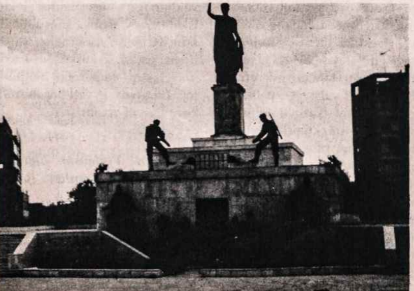
Nikosija. Kipro laisvės paminklas.

Pasak geologų, Kipro sala buvo iškelta vulkaniško proveržio iš Tetys (Tethys) jūros dugno prieš milijonus metų.