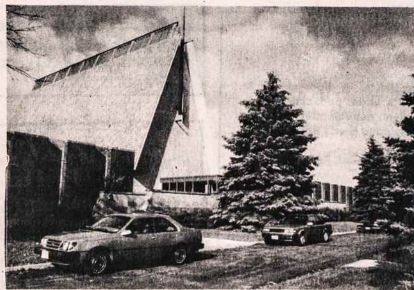
Bažnyčia lietuvių centre Lemonte, IL. Bažnyčioje jau vyksta pamaldos.

nė. Į kultūros apimtį įeina žodinė kūryba, menas, muziką. Bus ruošiami teatro festivaliai, dainų šventės, poezijos pavasariai ne tik Chicagoje. Ateities dainų šventė turėtų įvykti 1990 m.