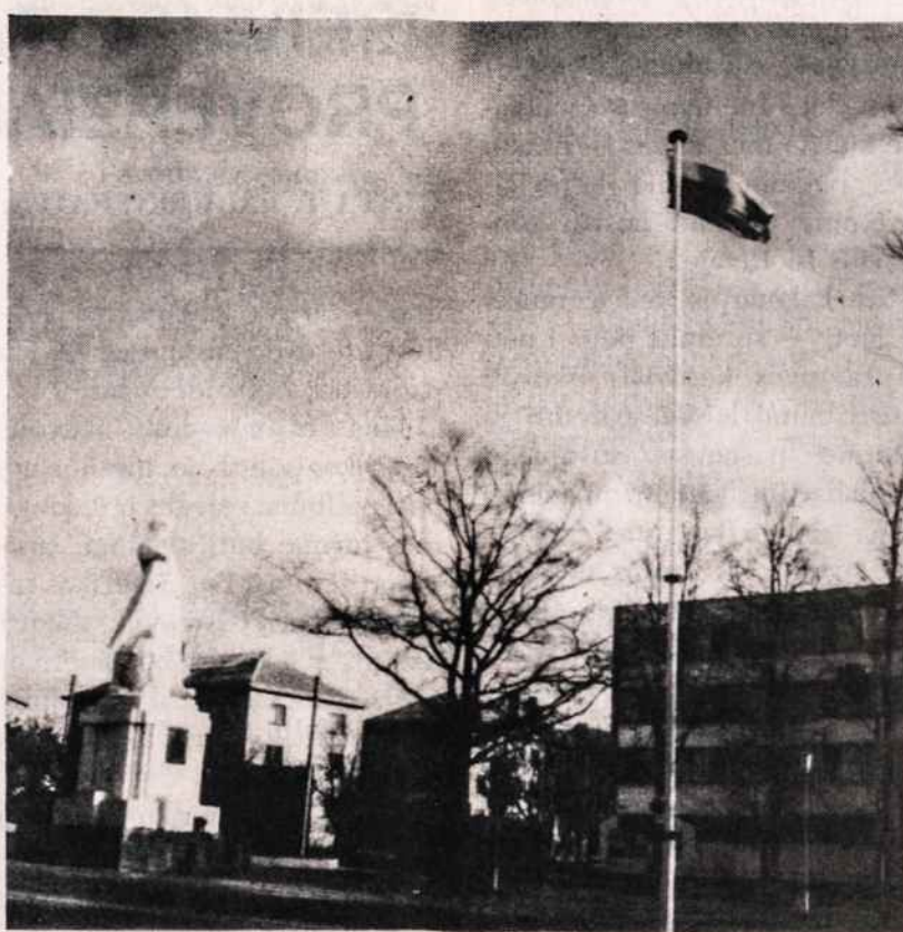
Raseiniuose spalio 29 su didelėm iškilimėm buvo pakabinta lietuviška trispalvė Žemaičio aikštėje, toje aikštėje, kur stovi skulptoriaus V. Grybo sukurta statula — Žemaitis. Prieš pakabinimą vėliava bažnyčioje buvo pašventinta. Žmonių buvo pilnutėlė bažnyčia, ir į aikštę susirinko tūkstančiai.

a) atsisakyti Ribbentropo - Molotovo pakto bei jo padarinių