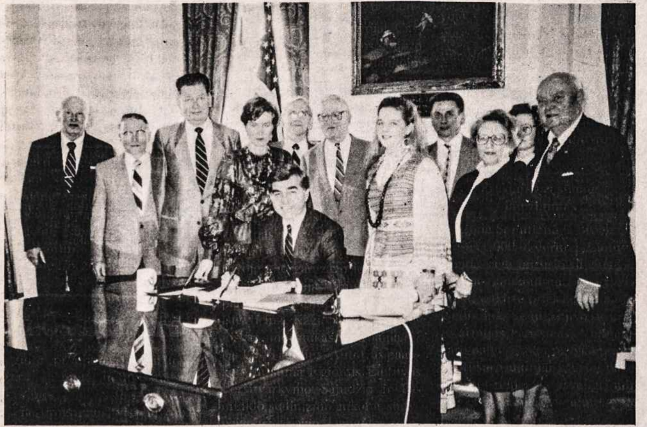
Lietuvių atstovai pas Massachusetts gubernatorių Mike Dukakis, kai jis vasario 1 pasirašė proklamaciją.

Tuo baigtas minėjimas. Norintieji dar galėjo užkasti ir pabendrauti su programų atlikėjais