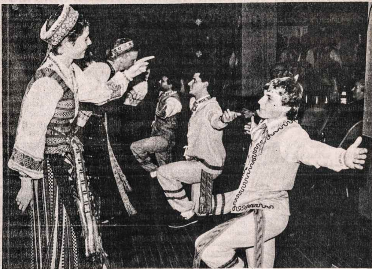
Hartfordo tautinių šokių grupė Berželis sausio 21 šoko Šv. Andriejaus parapijos salėje New Britaine. Čia matome atliekant šokį "Grasiuką".