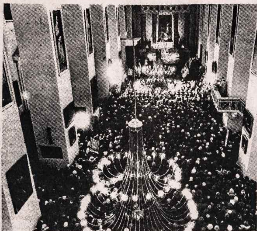
Vilniaus arkikatedros vidus jos atšventinimo iškilmėse Kliše iš š. m. "Tiesos" vasario 7 d. nr. 32.