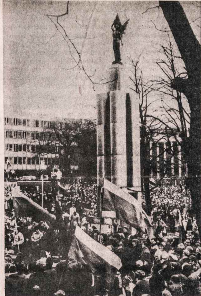
Laisvės paminklo atidengimo iškilmės Kaune. Minių minios ir daugybė veliavų tvindė aikštę prie statulos. Reuterio agentūros pranešimu, Kauno gatvėse liejosi 200,000 minia su veliavom ir dainom. Kliše paimta iš "Kauno tiesos" vasario 17 dienos numerio.

5. Kovo 18 d. Apklausa pradėta 23 val., baigta 19 d. 2 val. (nukelta į 2 psl.)