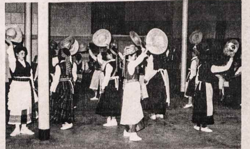
Brocktono Šv. Kazimiero parapijos mokyklos mokiniai šoka Kepurinę.