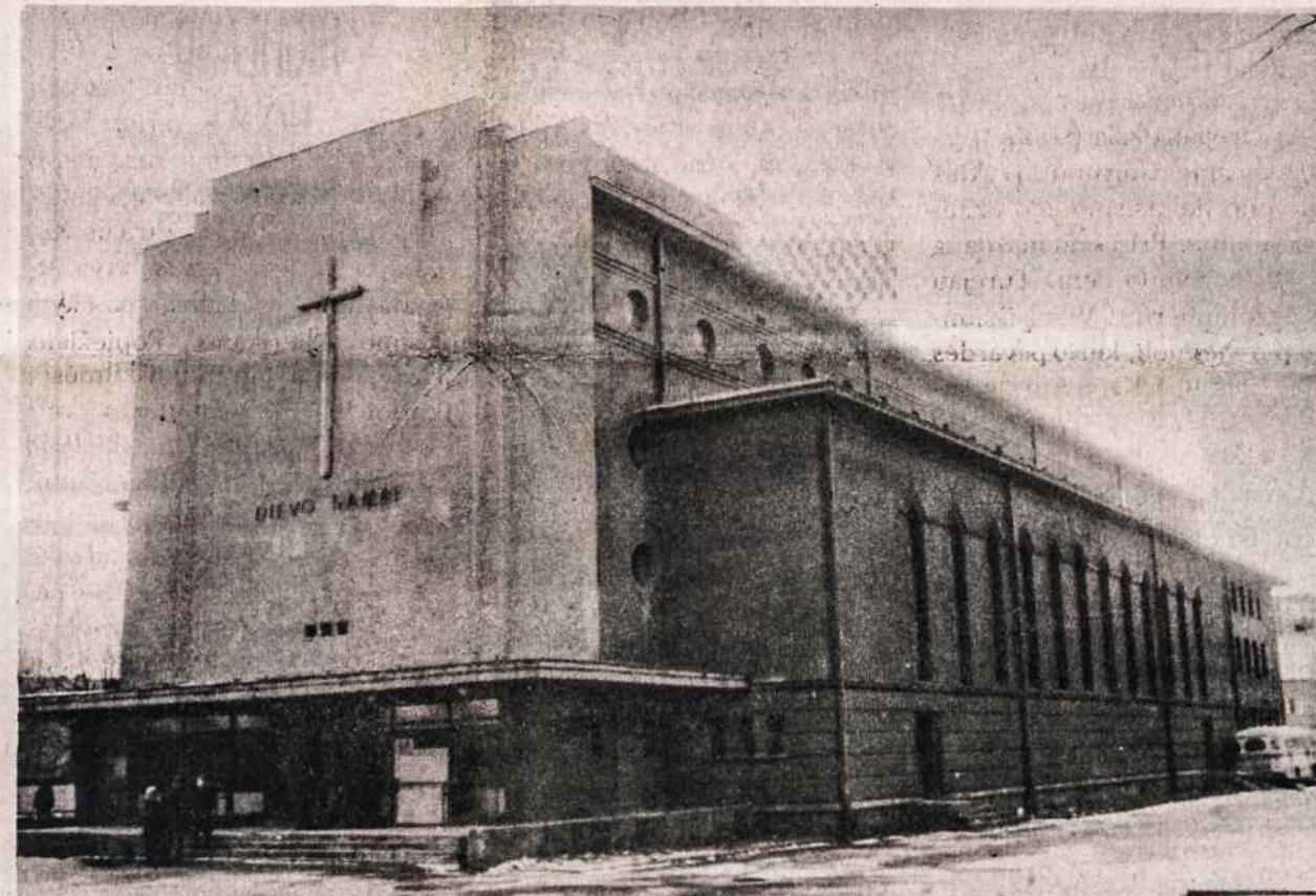
Jau ne filharmonija, o bažnyčia. Ten, kur buvo lyros reljefas, dabar pakabintas didelis kryžius. Žemiau įrašyta — Dievo namai.

Pati idėja tikrai verta didelio dėmesio, verta dėl jos aukotis, nes alkančiai tiesos Lietuvai pasiūsiame geras knygas. Propaguokime tą idėją apiforminkime techniškai knygų rinkimą, rūšiavimą, parengimą siuntimui. Ir čia galima įjungti labai daug žmonių, nes gerų knygų turime tikrai daug.