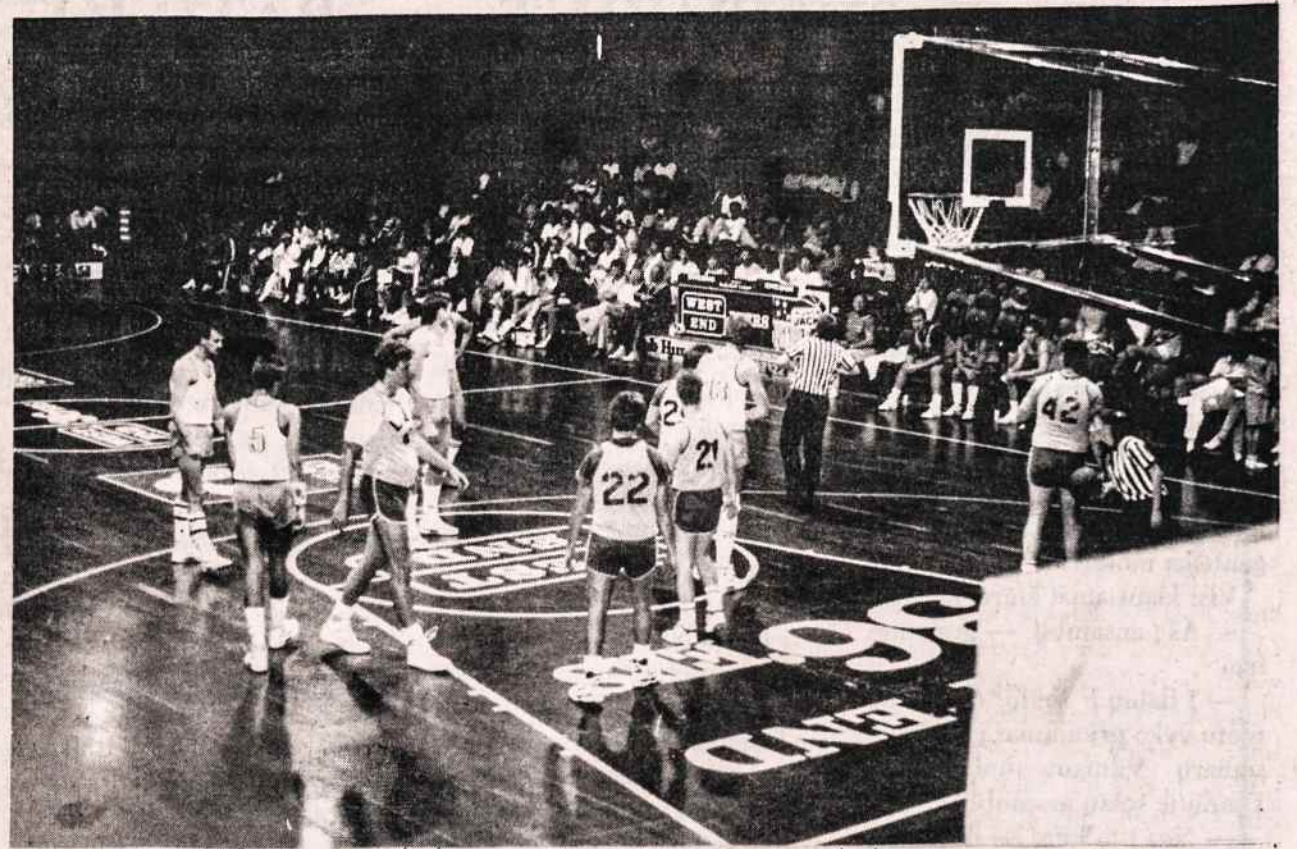
Pasaulio lietuvių trečiose sporto žaidynėse Adelaidėje dėl aukso ir sidabro medalių finalinėse krepšinio rungtynėse susitiko New Yorko Liet. Atletų Klubo komanda su Lietuvos jaunimo rinktine. Aukso medalį laimėjo Lietuvos jaunimo rinktinė, sidabro LAK komanda