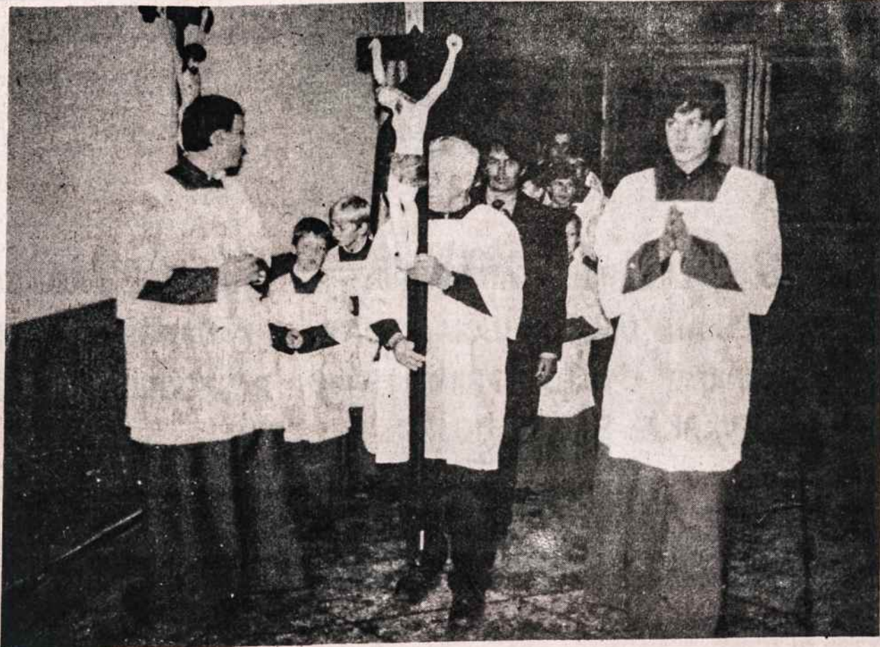
Ižengiama į atgautą Taikos Karalienės bažnyčią. Pirmą nešamas kryžius. Tai buvo 1988 lapkričio 25 d.

PIRMAUJANTI DEŠRŲ PREKYBA NEW YORKE VOKIŠKOS SPECIALYBĖS