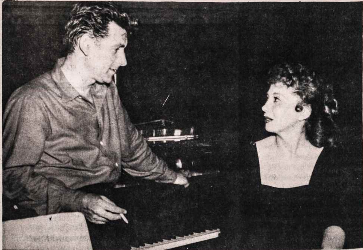
Koncertas "Great Performances — Bernstein at 70" bus transliuojamas kovo 19 per New Yorko 13-tą televizijos kanalą ir per kitas stotis JAV. Čia matome Vytauto Maželio nuotraukoje kompozitorių ir dirigentą Bernstein ir solistę Beverly Sills repeticioje prieš koncertą 1956 vasario 7 New Yorke.