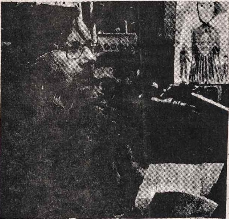
Vytautas Landsbergis, Lietuvos Persitvarkymo Sąjūdžio vadovas, kalba Vilniuje priešrinkiminiame mitinge.