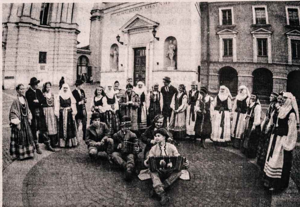
"Ratilio", Vilniaus universiteto folklorinis ansamblis atvyksta gastrolėm į JAV ir į Kanadą balandžio mėn. Čia dalis ansamblio matomi universiteto kieme. Jie koncertuos Philadelphijoje, New Yorke, Bostone, Hartforde, Clevelande, Detroite, Toronte ir Chicagoje.