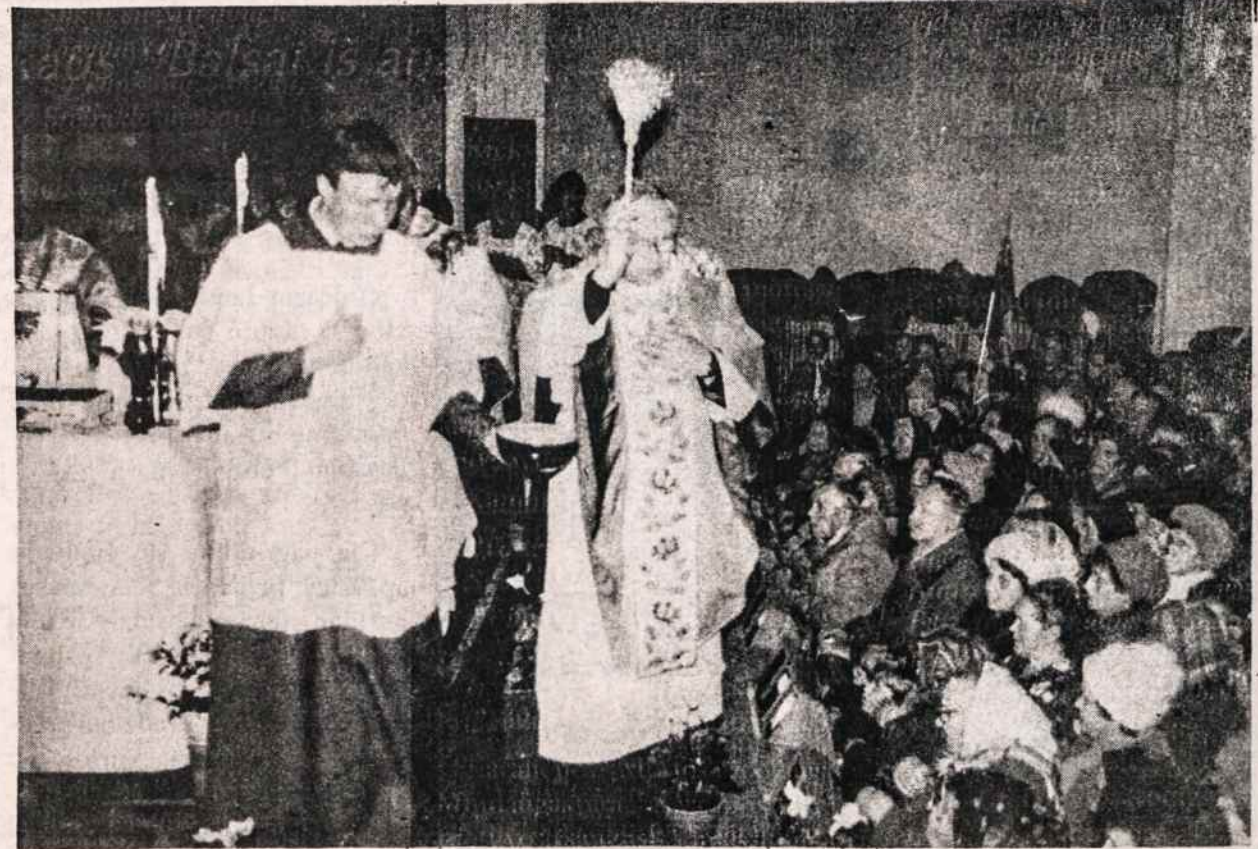
Telšių vyskupas Antanas Vaičius šventina atgautą Taikos Karalienės bažnyčią 1988 lapkričio 25 d.