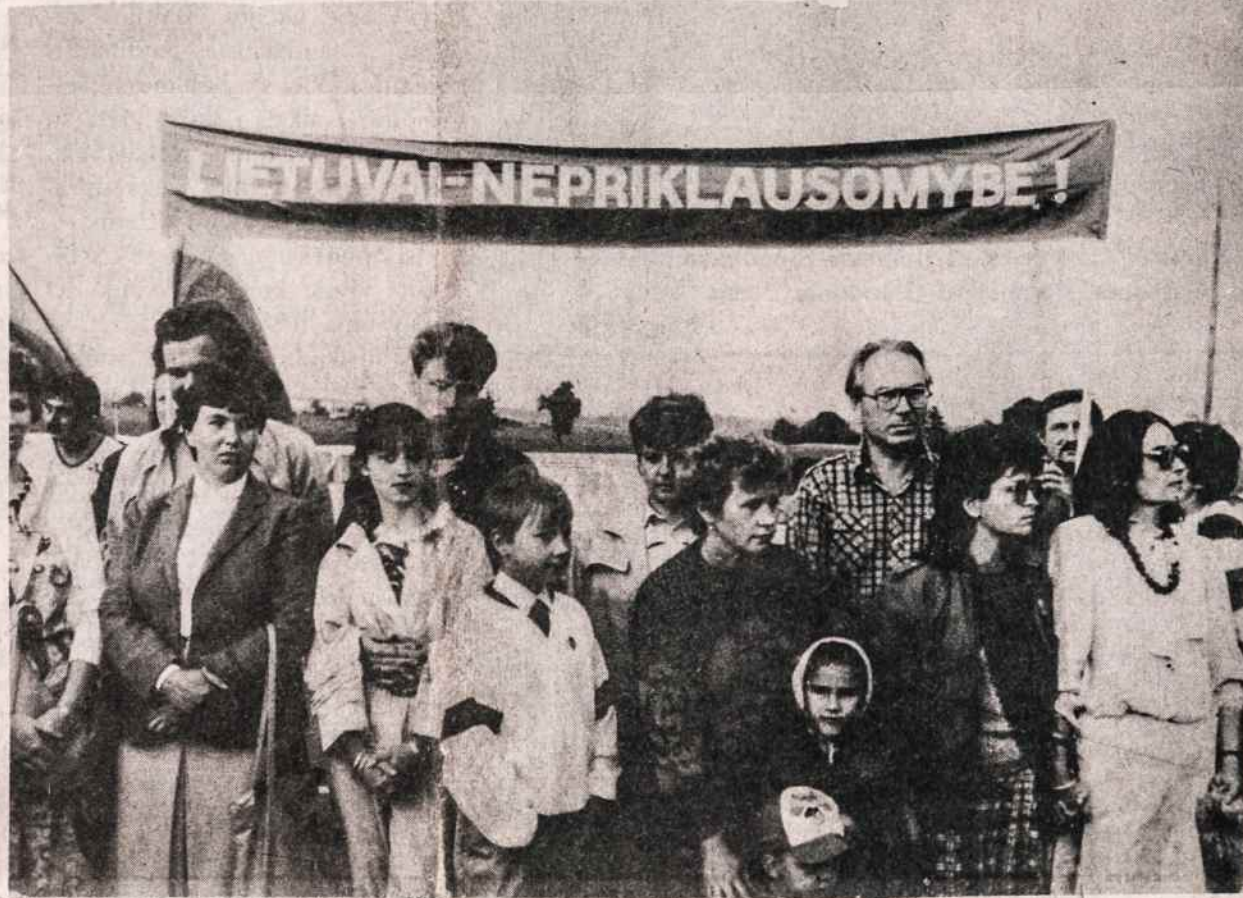
Demonstracijos Lietuvoje, Lietuvai reikalaujama nepriklausomybės.

Senatoriaus Moynihan telefonas ir adresas: 212 661-5150, 733 Third Ave., New York, N.Y. 10017.