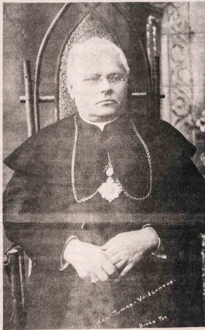
Kanauninkas Juozas Tumas-Vaižgantas, žurnalistas, įvairių laikraščių redaktorius, lietuvių literatūros klasikas, kurio 120 metų gimimo sukaktį rugsėjo 20 paminėjo lietuvių tauta.