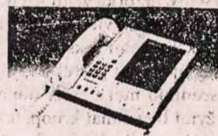
TELEFONŲ ATSAKŲ APARATAI