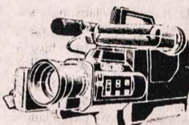
PANASONIC M7 COMCORDER VIDEO FILMAVIMO APARATAI PAL SISTEMAI