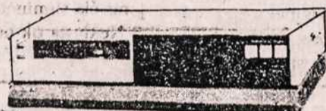
VCR (Video juostų rekordavimo ir grojimo aparatai) PAK/SECAM/DK SISTEMAI (Ivairių firmų, įskaitant ir Panasonic)

VISA APARATŪRA TURI PAAIŠKINIMUS IR RUSŲ KALBA