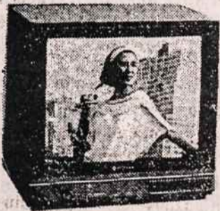
TELEVIZIJOS APARATAI (Ivairaus dydžio ir įvairių firmų)

ELECTRONICS 200 5TH AVE (tarp 23 & 24 Gatvių) NEW YORK, N.Y. 10010 TELEFONAS (212) 807 - 8484