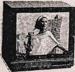
TELEVIZIJOS APARATAI (Įvairaus dydžio ir įvairių firmų)

ELECTRONICS 200 5TH AVE (tarp 23 & 24 Gatvių) NEW YORK, N.Y. 10010 TELEFONAS (212) 807 - 8484