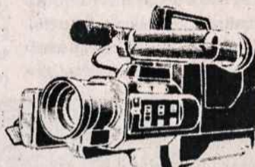
PANASONIC M7 COMCORDER VIDEO FILMAVIMO APARATAI PAL SISTEMAI