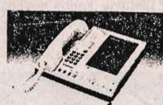
TELEFONŲ ATSAKŪMO APARATAI