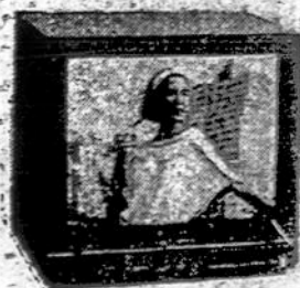
TELEVIZIJOS APARATAI (įvairaus dydžio ir įvairių firmų)

200 5TH AVE (tarp 23 & 24 Gatvių) NEW YORK, N.Y. 10010 TELEFONAS (212) 807 - 8484