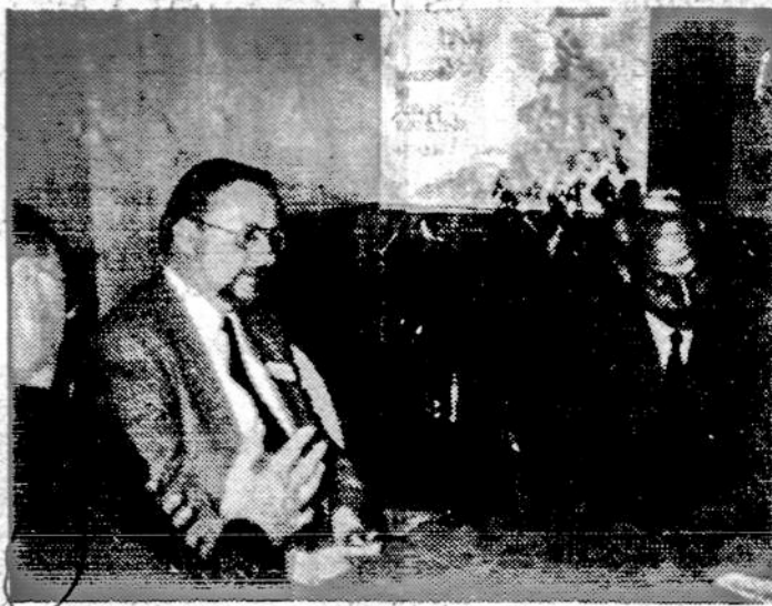
Lietuvos AT tarybos pirm. V. Landsbergis pokalby su Šveicarijos Federacijos buv. prezidentu Rudolf Friedrich.

Kiek švelnesnę gaidą užgrojo Lietuvos min. Algirdas Saudargas. Jis užsiminė apie dainuojančius pabaltiečius (singing Balts) ir gyvųjų grandį. Jis priminė, kad nors dainos sopulingos (sor-