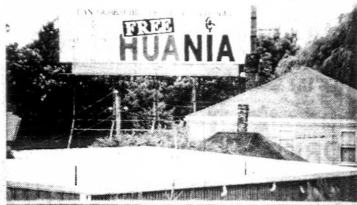
Skelbimas prie greitkelio Nr. 3, įvažiuojant į Bostoną, prie Neponset Circle.