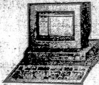
KOMPIUTERIAI LYGŪS IBM PC SISTEMAI SU SPALVOS REGULIAVIMO IR ATSPAUSDINIMO APARATŪRA

Visi kompiuteriai gaminti 1989 metais amerikiečių firmos INNOVATION, kuri duoda vienerių metų garantiją Lietuvoj