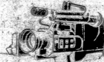
PANASONIC M7 COMCORDER VIDEO FILMAVIMO APARATAI PAL SISTEMAI