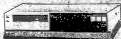
VCR (Video juostų rekordavimo ir grojimo aparatai) PAK/SECAM/DK SISTEMAI (įvairių firmų, įskaitant ir Panasonic)

VISA APARATŪRA TURI PAAIŠKINIMUS IR RUSŲ KALBA