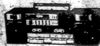
ĮVAIRŪS RADIO APARATAI SU TRUMPŲM BANGŲM