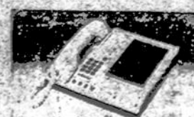
TELEFONŲ ATSAKYMŲ APARATAI