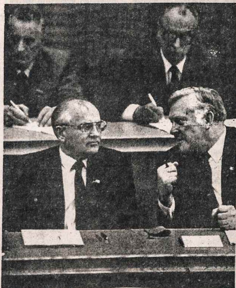
Algirdas Brazauskas, Lietuvos Komunistų Partijos Centro Komiteto pirmasis sekretorius, išreiškia savo nuomonę Tarybų Sąjungos prezidentui Gorbačioviui, kai jis pereitą savaitę lankėsi Lietuvoje.

Reikia tačiau pripažinti, kad pereitą savaitę buvo viena prošvaitė šiame JAV tylos sąmokslė. Valstybės departamentas išleido pareiškimą, kuriame patvirtinama, kad JAV nepripažįsta Pabaltijo kraštų aneksijos į tarybų Sąjungą ir kad remia jų laisvą apsisprendimą taikiu būdu. Šiame pareiškime valstybės departamentas kritikavo Jungtines Tautas už tai, kad jos nutraukė ryšius su neoficialiomis pabaltiečių organizacijomis, kurios siekia tų kraštų nepriklausomybę