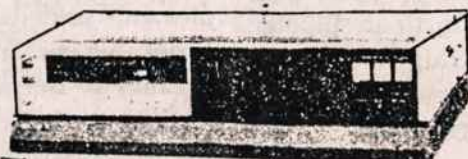
VCR (Video juostų rekordavimo ir grojimo aparatai) PAK/SECAM/DK SISTEMAI (įvairių firmų, įskaitant ir Panasonic)

VISA APARATŪRA TURI PAAIŠKINIMUS IR RUSŲ KALBA