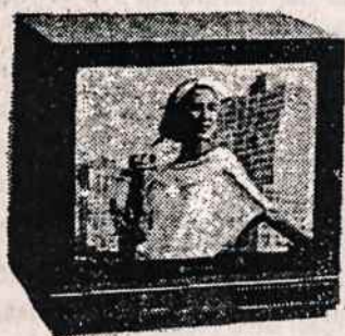
TELEVIZIJOS APARATAI (įvairaus dydžio ir įvairių firmų)

ELECTRONICS 200 5TH AVE (tarp 23 & 24 Gatvių) NEW YORK, N.Y. 10010 TELEFONAS (212) 807 - 8484