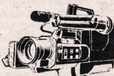
PANASONIC M7 COMCORDER VIDEO FILMAVIMO APARATAI PAL SISTEMAI