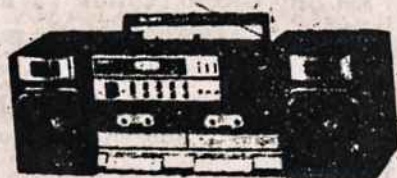
ĮVAIRŪS RADIO APARATAI SU TRUMPOM BANGOM