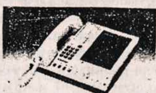
TELEFONŲ ATSAKYO APARATAI