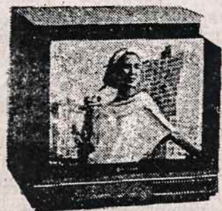
TELEVIZIJOS APARATAI (Ivairaus dydžio ir įvairių firmų)

ELECTRONICS 200 5TH AVE (tarp 23 & 24 Gatvių) NEW YORK, N.Y. 10010 TELEFONAS (212) 807 - 8484