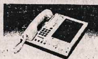
TELEFONŲ ATSAKYO APARATAI