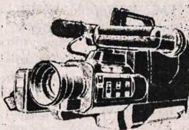
PANASONIC M7 COMCORDER VIDEO FILMAVIMO APARATAI PAL SISTEMAI