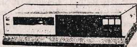
VCR (Video juostų rekordavimo ir grojimo aparatai) PAK/SECAM/DK SISTEMAI (Ivairių firmų, įskaitant ir Panasonic)

VISA APARATŪRA TURI PAAIŠKINIMUS IR RUSŲ KALBA