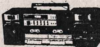
ĮVAIRŪS RADIO APARATAI SU TRUMPOM BANGOM