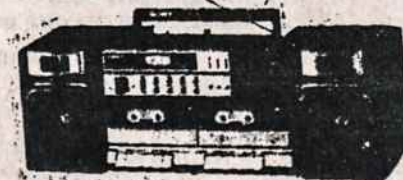
ĮVAIRŪS RADIO APARATAI SU TRUMPOM BANGOM