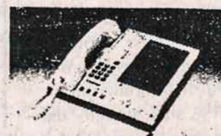
TELEFONŲ ATSAKYO APARATAI