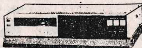
VCR (Video juostų rekordavimo ir grojimo aparatai) PAK/SECAM/DK SISTEMAI (Ivairių firmų, įskaitant ir Panasonic)

VISA APARATŪRA TURI PAAIŠKINIMUS IR RUSŲ KALBA