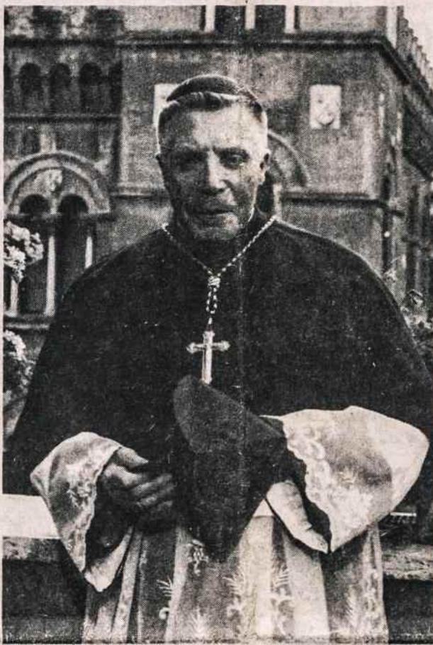
Lietuvos kardinolas V. Sladkevičius