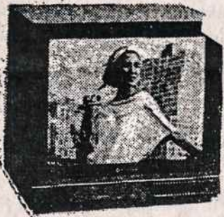
TELEVIZIJOS APARATAI (Ivairaus dydžio ir įvairių firmų)

ELECTRONICS 200 5TH AVE (tarp 23 & 24 Gatvių) NEW YORK, N.Y. 10010 TELEFONAS (212) 807 - 8484