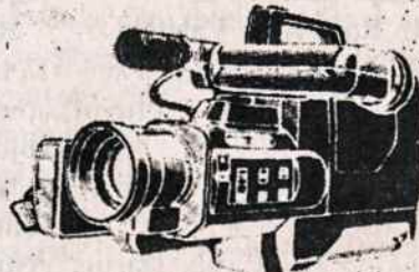
PANASONIC M7 COMCORDER VIDEO FILMAVIMO APARATAI PAL SISTEMAI