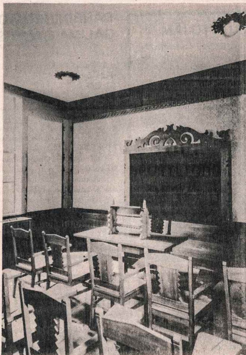
Pittsburgho universitete lietuvių kambarys.