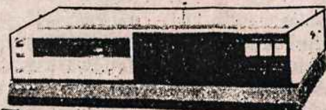
VCR (Video juostų rekordavimo ir grojimo aparatai) PAK/SECAM/DK SISTEMAI (įvairių firmų, įskaitant ir Panasonic)

VISA APARATŪRA TURI PAAIŠKINIMUS IR RUSŲ KALBA