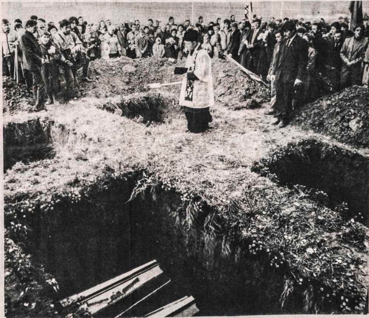
Lietuviai partizanai perlaidojami Rietave 1990 spalio 14.

Pabrėždamas paramos svarbą, Chicagos kardinolas Bernardin, (nukelta į 2 psl.)