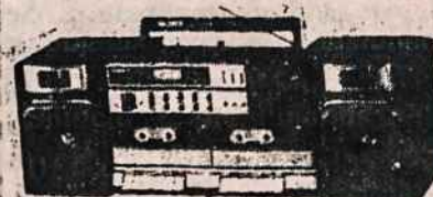
ĮVAIRŪS RADIO APARATAI SU TRUMPOM BANGOM