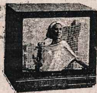
TELEVIZIJOS APARATAI (įvairaus dydžio ir įvairių firmų)

ELECTRONICS 200 5TH AVE (tarp 23 & 24 Gatvių) NEW YORK, N.Y. 10010 TELEFONAS (212) 807-8484