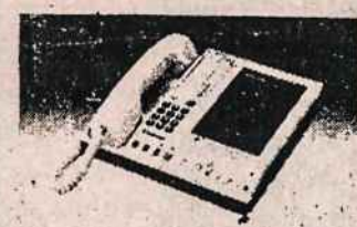
TELEFONŲ ATSAKYO APARATAI