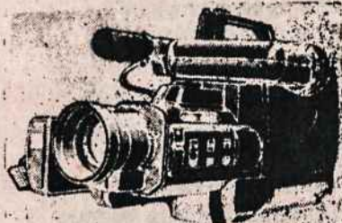
PANASONIC M7 COMCORDER VIDEO FILMAVIMO APARATAI PAL SISTEMAI