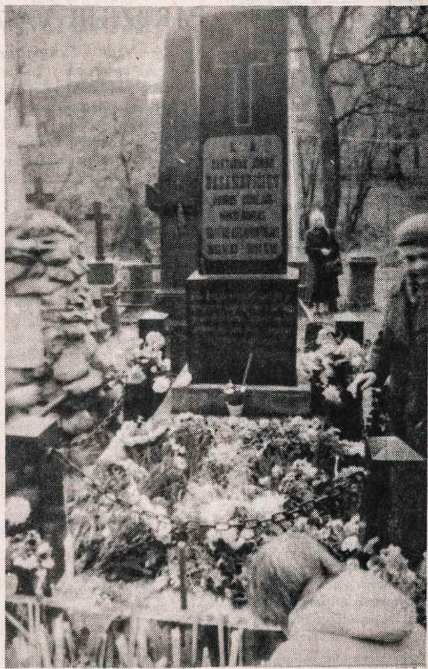
Dr. J. Basanavičiaus kapas 1990 m. Vėlinėse.